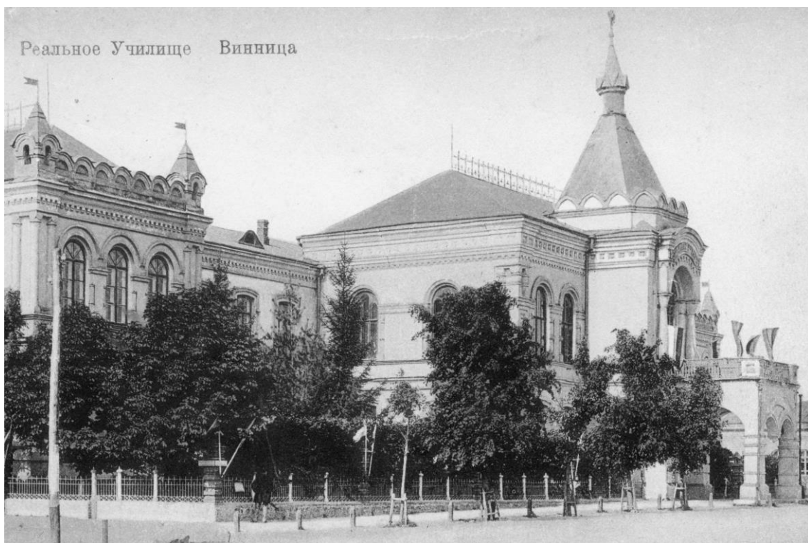
Рис. 1. Будівля учбового корпусу вінницького реального училища (з листівки 1900-х рр.).

Реальне училище було типом середнього навчального закладу, в якому обов'язкові латинська та грецька мови були замінені на сучасні європейські, на відміну від класичного училища. Також головна увага приділялася вивченню технічних наук. Зі спогадів мемуариста, випускника вінницького середнього навчального закладу, Яна Лазовського: “Російське чоловіче реальне училище виникло вже в ХІХ ст. і розміщувалось у власному будинку з садом. Воно мало сім класів і підготовчий. Дирекція та вчительський персонал були, за винятком ксьондза-законовчителя, виключно російськими. Рівень навчання був більше ніж добрий”. [4] (Рис. 1)