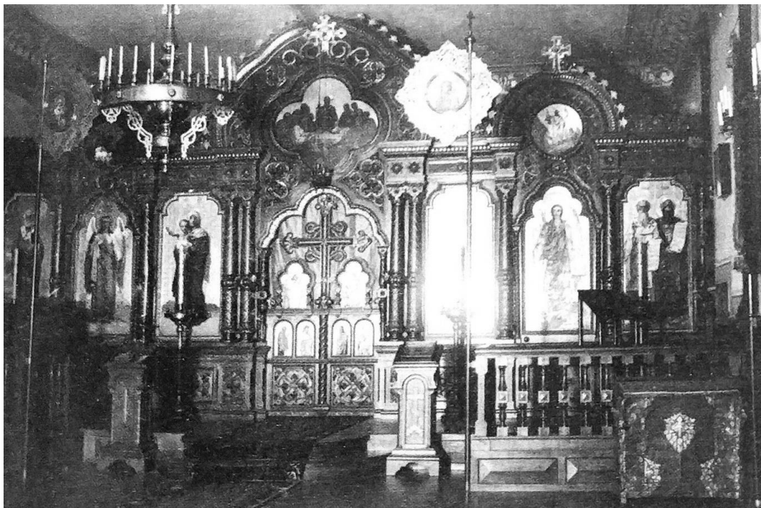
Рис. 4. Училищна домова церква (фото 1915 р.).

Важливою подією у житті училища стало відкриття церкви на другому поверсі, що була освячена в ім'я рівноапостольних Кирила та Мефодія. Іконостас для церкви виконав український живописець О. Мурашко. [3] (Рис. 4) Закон Божий викладав талановитий педагог, автор ряду наукових праць з історії Поділля, священник І. О. Шипович, [3]