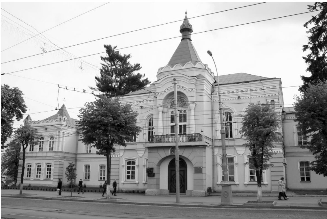
Рис. 6. Будівля ВТЕІ КНТЕУ (фото автора, 2017 р.).

Нині тут розмістився Вінницький торговельно-економічний інститут Київського національного торговельно-економічного університету. (Рис. 5)