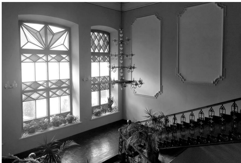
Рис. 3. Організація простору сходової клітки (фото автора, 2017 р.).

Коридорне планування відповідало сучасним вимогам організації простору навчального закладу. Класні кімнати світлі, просторі, мали пічне опалення. У вестибюлі – парадні багатомаршеві чавунні сходи, на яких викарбуваний напис, що зберігся до наших днів: “Чугунно-литейный и механический заводъ. Винница”. [7] Промені, що пронизують яскраве вітражне панно, чудово освітлюють внутрішній простір сходового маршу. (Рис. 3)