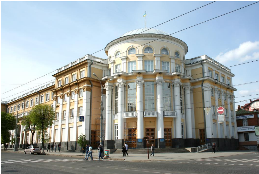
Рис. 9. Будівля Вінницької облрада та облдержадміністрація, вул. Соборній, 70,72. Фото автора 2016р.

Велична будівля Будинку організацій (1936-41, 1946-49 рр.) по вул. Соборній, 70,72, є прикладом неокласичної архітектури (нині будівля Вінницької облради та облдержадміністрації). Адміністративний будинок, що став однією з доміант правобережного міста, будували за проектом та консультацією П. Ф. Альошина архітекторами С. І. Рабіним, Л. О. Черленіовським. Модернізований «великий» іонічний ордер, у якому вирішено архітектоніку фасадів, являє шість колон на три поверхи півкруглого ризаліту і ритм відповідних пілястр бічних прямокутних ризалітів, фланкуючих кутову форму та півкруглий ганок. Великий кутовий об'єм завершено напівсферичним куполом півкруглого ризаліту із головним входом, має чотири основні поверхи, п'ять рівнів (включно з рівнем балкону-антресолю у верхній залі засідань), просторий підвал із початковими функціями бомбосховища [4] (Рис. 9).