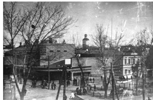
Рис. 8. Кінотеатр ім. М. Коцюбинського, вул. Соборна, 52. Фото 1931р. [11]

Засоби нової архітектури знаходили найліпше втілення в архітектурі виробничих споруд. У 1920-1930 рр. збудовано сірчано-кислотний цех суперфосфатного заводу, м'ясокомбінат, державна швейна фабрика, кондитерська фабрика, плодозавод, паротурбінна електростанція та інші [10].