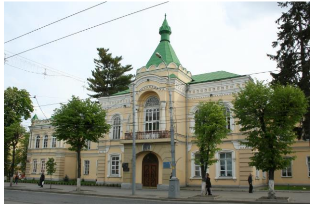
Рис. 2. Вінницький торгово-економічний інститут, вул. Соборна, 87. Фото автора 2016р.

Наприкінці ХІХ ст., завдяки ряду чинників, розпочалися важливі перетворення міського середовища: запроваджено загальне планувальне поєднання частин міста та поступова заміна дерев'яних та валькових будинків кам'яними; які за короткий термін змінили обличчя міста.