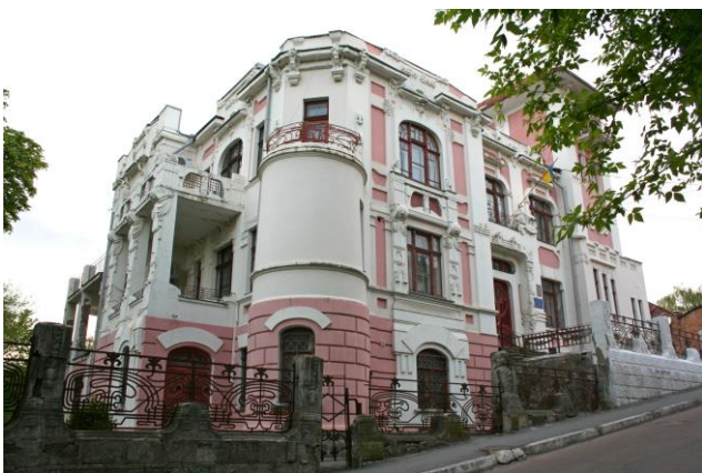
Рис. 5 Будівля Департаменту архітектури та містобудування Вінницької міської ради, вул. Пушкіна, 38. Фото автора 2016р.

На початку ХХ століття значного розвитку в модерністичній архітектурі країн Східної Європи набув пошук національної своєрідності. УАМ (український архітектурний модерн) поєднував у собі народні традиції хатнього і церковного будівництва та досягнення української професійної архітектури. Єдиний відомий будинок у цьому стилі – садиба лікаря М. Стаховського, (1914-15 рр.), вул. Ф. Верещагіна, 6. Автор ескізу – один із найвідоміших сподвижників УАМу, В. Г. Кричевський, будівельний контроль вів архітектор Г. Г. Артинов. Після реконструкції, цілком втратив оздоблення фасадів, набувши спрощеного зовнішнього вигляду [4] (Рис. 6).