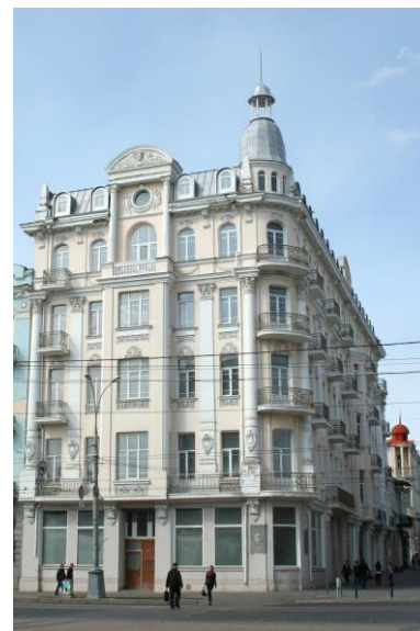
Рис. 4. Готель «Савой», вул. Соборна, 48.

Садиба капітана О. Четкова (1910 р.), вул. Пушкіна, 38 – один з найдовершеніших та найдорожчих будинків того часу у місті. Автор проекту модернової будівлі «віденської сецесії» – відомий архітектор В. П. Листовничий. Триповерхова з підвалом, потинькована. У оформленні фасадів домінують декоративні форми і деталі типові для модерну: великі арокні та круглі вікна, увінчані завитками та рослинним орнаментом; чисельні живописні рельєфи із зображенням великих квітів; витончений карниз із кронштейнами; металеві та бетонні огороження балконів. Нині в будівлі міститься департамент архітектури та містобудування Вінницької міської ради [3] (Рис. 5).