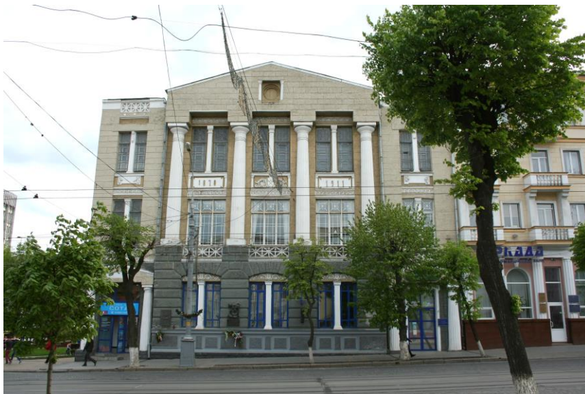
Рис. 3. Вінницька торгово-промислова палата, вул. Соборна, 67.