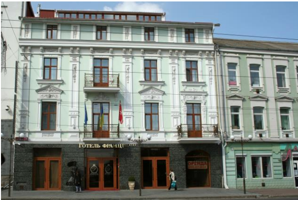
Рис. 1. Готель «Франція», вул. Соборна, 34. Фото автора 2016р.

Наслідування давньоруської та візантійської форми набули своє відображення в архітектурі будівлі реального училища (нині Вінницький торгово-економічний інститут по вул. Соборній, 87). Споруджена до 1888 р. за проектом архітектора М. Чекмарьова, коштом купця Ц. Вайнштейна. У 1889 р. з боку сучасної вул. Театральної до основного будинку училища зроблено прибудову за проектом архітектора В. Краузе. Двоповерхова цегляна будівля має три ризаліти, що завершуються шатровим покриттям. Центральний ризаліт має виступаючий об'єм головного вхідного тамбуру й оформлений по другому поверху портиком з двома колонами, підкресленими ентазисом та завершеними яйцеподібними капітелями. Кути ризалітів підкреслені рустами та лопатками. Вікна другого поверху мають напівциркульні аркові перемички. Планування приміщень коридорне. Класні кімнати світлі, просторі [5] (Рис. 2).