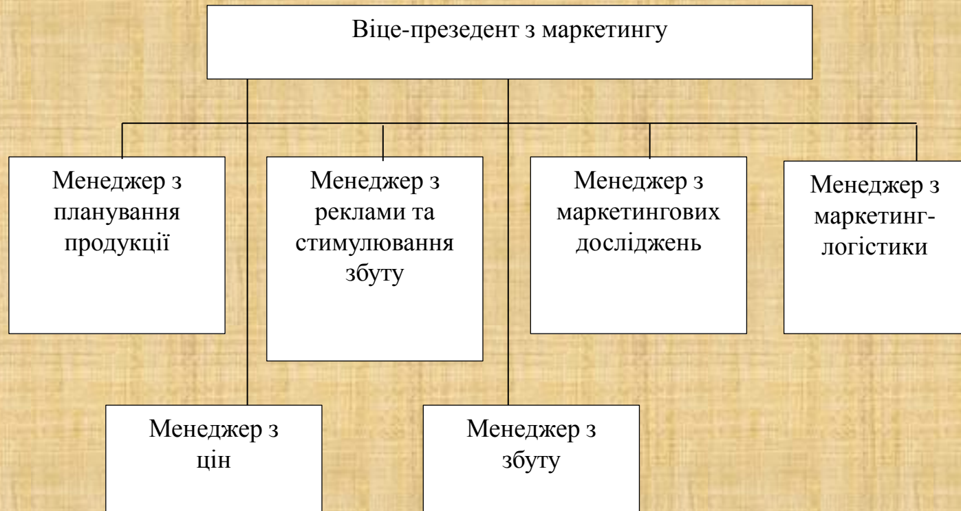
Рисунк 3.1 – Замакетована структура маркетингового відділу ПрАТ «Білоцерківський завод ЗБК»

На мою думку, саме така організаційна структура маркетингового відділу буде найбільш доцільною для ПрАТ «Білоцерківський завод ЗБК»