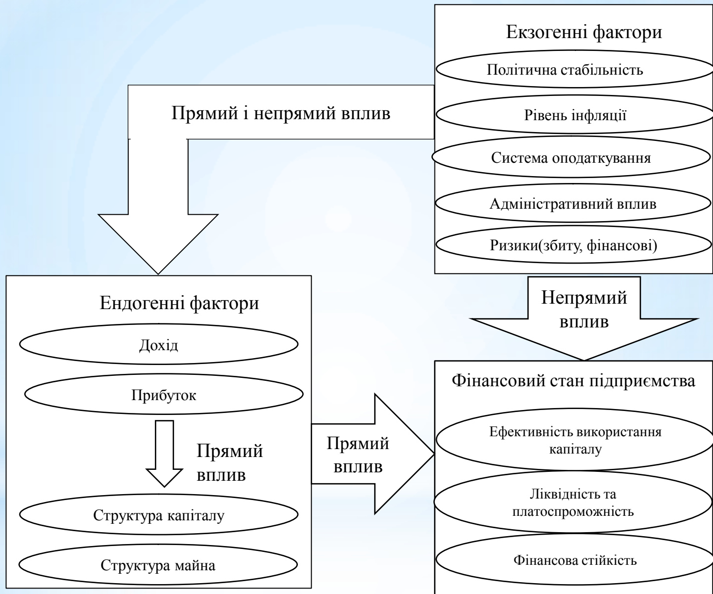
Рисунок 1.2 – Взаємозв'язок факторів впливу на фінансовий стан