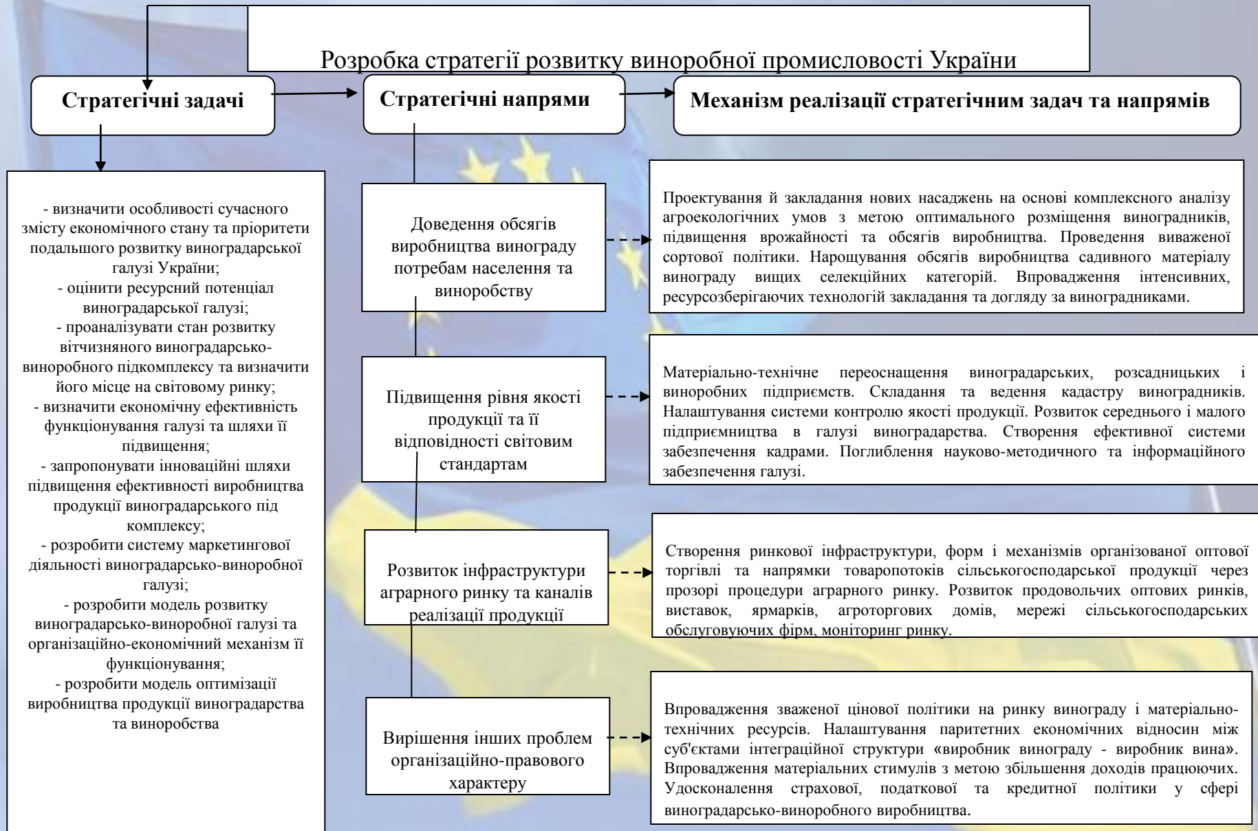
Рисунок 2 – Модель стратегії розвитку виноробної промисловості України