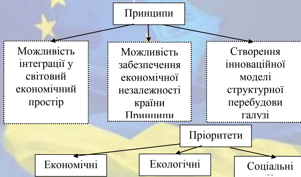
Рисунок 1 – Принципи та пріоритети стратегії розвитку виноградарства і виноробства України