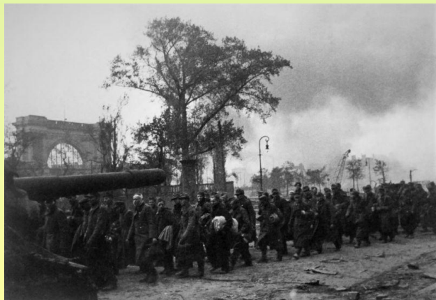
Вони вважали, що підкорять весь світ. «Колонна немецьких військовоплєнних идєт мимо Лєртського вокзала (Lehrter Bahnhof) в Бєрліне. Слева находїтся советская САУ ИСУ-152»

Приймав парад перший радянський військовий комендант Берліна генерал-полковник, герой Радянського Союзу, Микола Єрастович Берзарін.