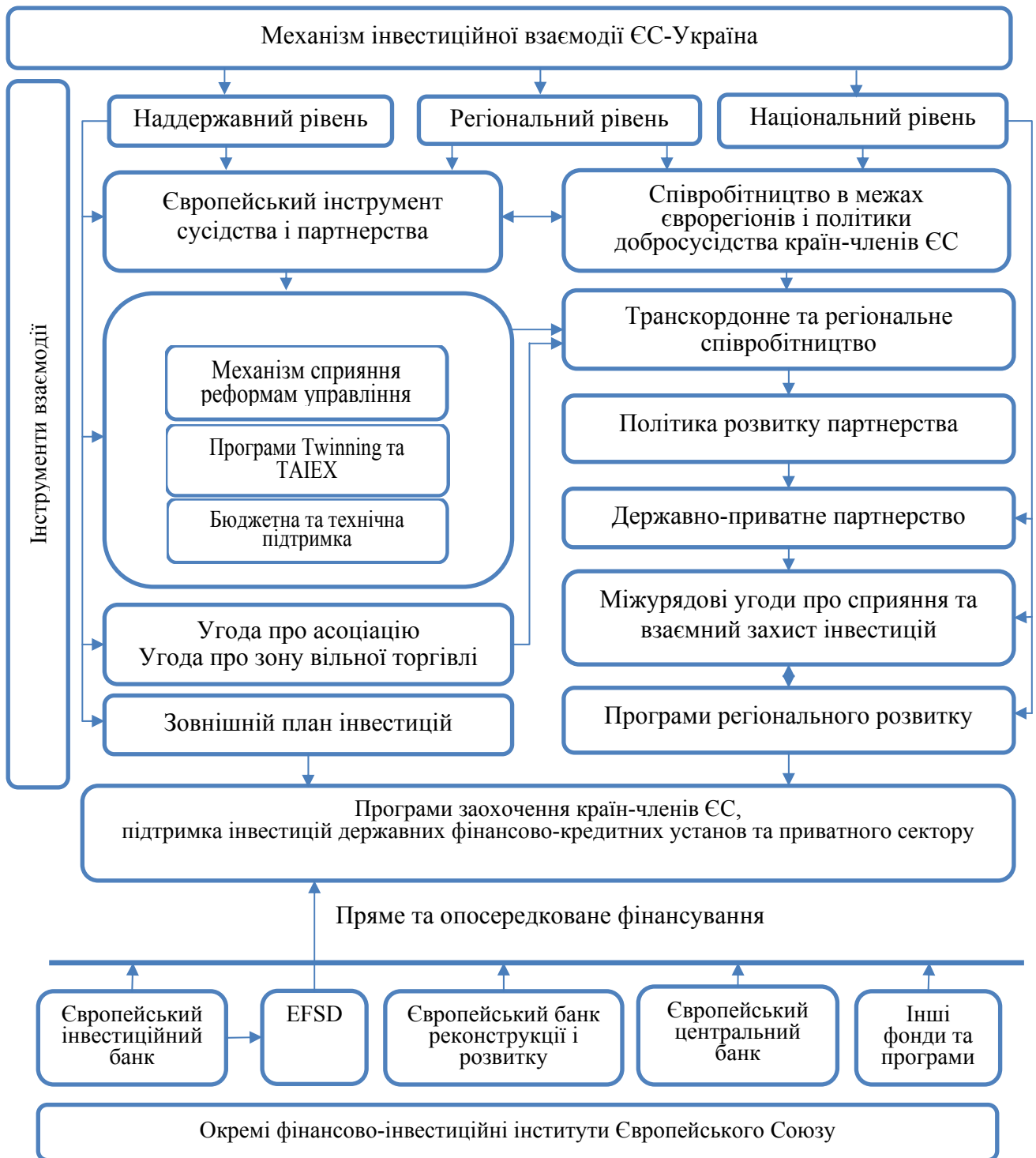
Рис. 4. Механізм інвестиційної взаємодії ЄС-Україна [розроблено авторами]

Варто відмітити, що значна увага ЄС приділяється саме підтримці інвестиційних проектів як засобами безпосереднього фінансування, так і опосередковано через створення відповідних програм заохочення країн-членів до здійснення капіталовкладень у перспективні бізнес-проекти.