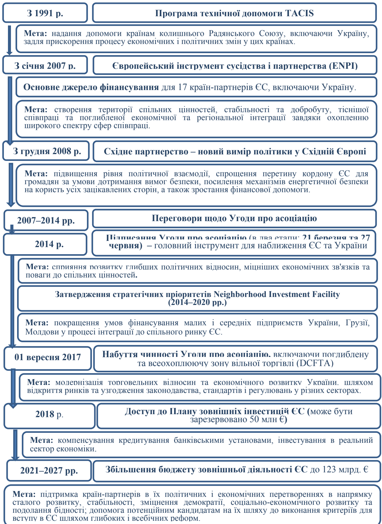
Рис. 2. Основні етапи інвестиційної взаємодії ЄС-Україна [розроблено авторами]

Для економіки України, яка потребує відновлення, важливими є саме зовнішні іноземні інвестиції, які є пріоритетним джерелом довгострокового зростання і дозволяють отримати ряд вигод.