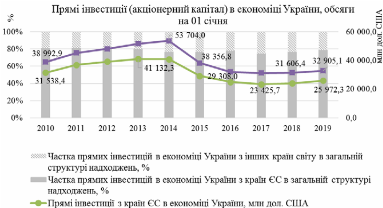
Рис. 3. Динаміка надходжень прямих інвестицій (акціонерного капіталу) в Україну протягом 2010–2019 рр. [побудовано за даними 9]

Обсяг прямих інвестицій (акціонерного капіталу) в економіку України з країн Європейського Союзу станом на 31 грудня 2019 р. склав 28289,3 млн дол. США, що становить близько 79 % від загального обсягу надходжень в Україну (рис. 3).