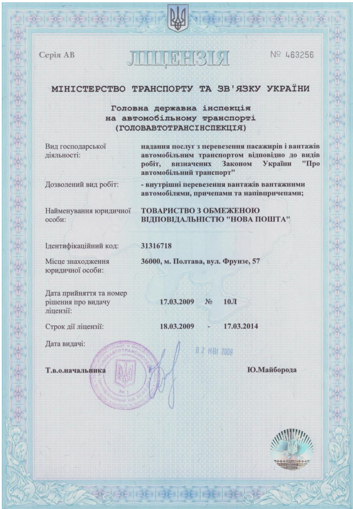
Рисунок 5.1 – Бланк (приклад) заповненої ліцензії