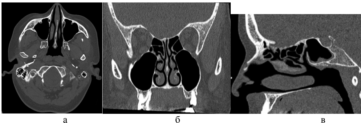
Рис. 2. – Комп'ютерно-томографічне дослідження носа та навколоносових пазух: а – аксіальний томографічний зріз, б – мультипланарна реконструкція у фронтальній проекції, в – мультипланарна реконструкція у сагітальній проекції

Наявність комп'ютерних томограм допомагає хірургові уникнути в ході операції ушкодження життєво важливих навколишніх структур: очниці, зорових нервів, основи черепа й великих судин. Дослідження проводять у аксіальній площині та за мультипланарними реконструкціями у фронтальній та сагітальній проекціях (див. рис. 2).