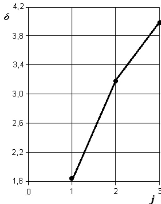
Рис. 3. – Графік збільшення нормованої Евклідової відстані при порівнянні порушення носового дихання з умовною нормою під час додавання даних різних діагностичних методів: оптичної ендоскопії, комп'ютерної томографії, риноманометрії ( j = 3 – розмірність простору інформативних параметрів)