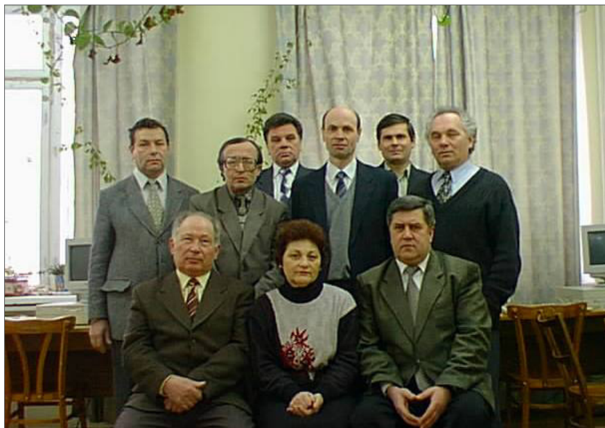
Кафедра теоретичної електротехніки та електричних вимірювань. Фото на згадку, 2014 р.