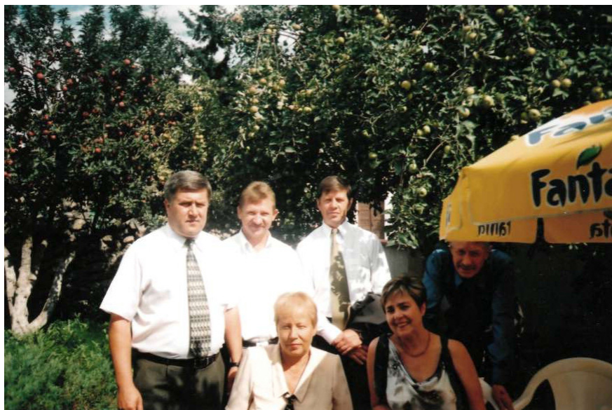
Зі шкільними друзями, 2004 р.