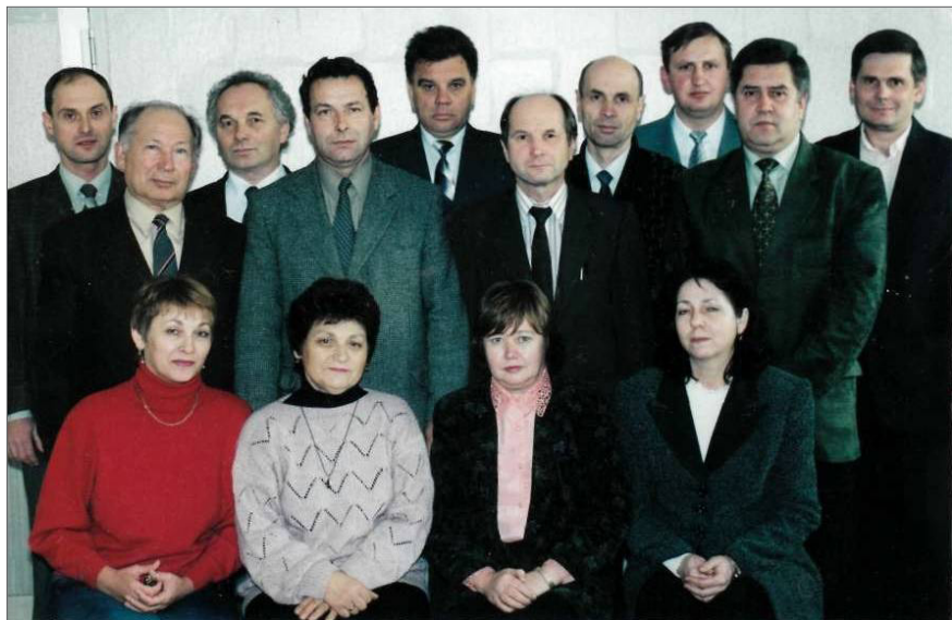
Колектив кафедри теоретичної електротехніки та електричних вимірювань. ВНТУ, 2005 р.