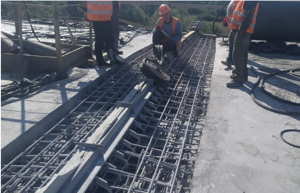
Рис 2. Монтаж металоконструкцій деформаційного шва Maurer.

пропонуються багатьма виробниками [3]. Такі шви забезпечують вільне переміщення сусідніх плит прогонових будов, водночас герметизуючи стик між ними, що забезпечує нормальний експлуатаційний стан верхньої частини мостових опор (рис. 2).