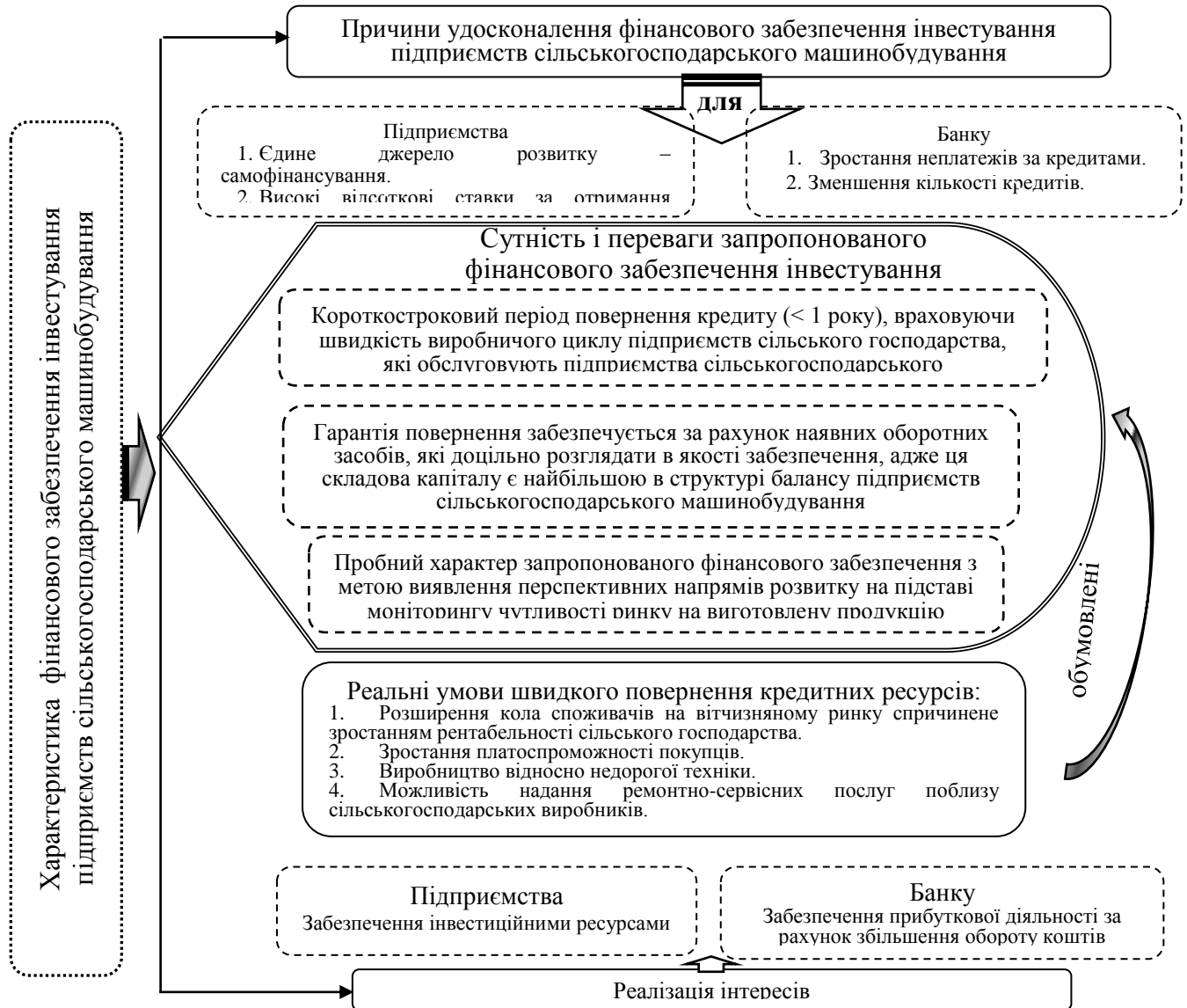
Рис. 4. Структурно-логічна модель фінансового забезпечення інвестування підприємств сільськогосподарського машинобудування