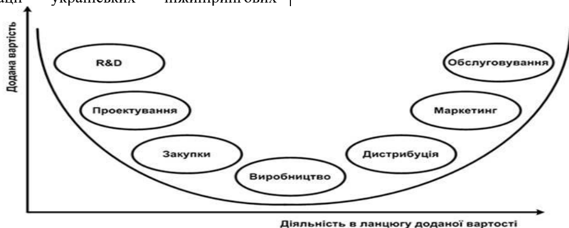
Рис. 1. Модель ланцюга доданої вартості[10]

У звітах ЮНІДО також наголошується, що кластери важливі саме для створення спеціалізованої інфраструктури та надання послуг, які можуть використовуватися кластерними компаніями, зменшуючи їхні індивідуальні інвестиції. Відповідно, українським кластерам з промисловості та хайтеку потрібно поглиблювати спеціалізацію у своїх нішах та цільових сегментах, розвивати конкурентні переваги на засадах інноваційності, якості, використання цифрових технологій.