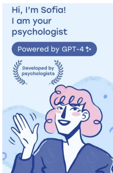
Рисунок 3 – Інтерфейс застосунку "OhSofia"

3. OhSofia! – Therapy AI Chat. Онлайн чат-бот Sofia на базі GPT-4 орієнтований на психологічну підтримку користувача (рис. 3). Програма використовує метафоричні асоціативні карти, створені психологами і художниками для дослідження свідомості респондента [4].