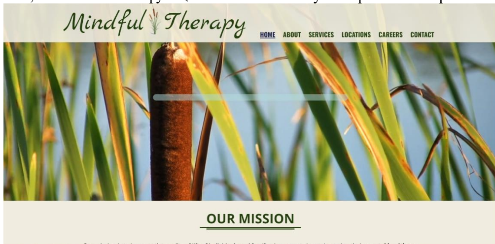
Рисунок 2 – Інтерфейс ресурсу "Mindful Therapy"

2. Mindful Therapy – це платформа, яка пропонує психологічну терапію у дистанційному форматі (рис. 2). Зв'язок з психологами здійснюється через систему повідомлень та чати. Сервіс орієнтований на листування й дистанційні консультації зі спеціалістами, має обмежений функціонал і не забезпечує інтерактивних тренінгів [3].