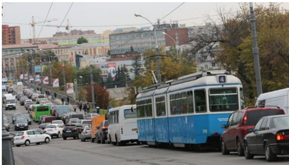
Рис. 1. Заторовий стан у центральній частині м. Вінниця

На прикладі міста Вінниці можна помітити, що результати моніторингу завантаження та швидкості транспортних потоків показують, що інтенсивність руху на міській мережі зростає нерівномірно. У центрі міста вона практично незмінна та стабілізувалася на рівні пропускної спроможності центральних вулиць, на периферії – зростає. Це звичайний процес.