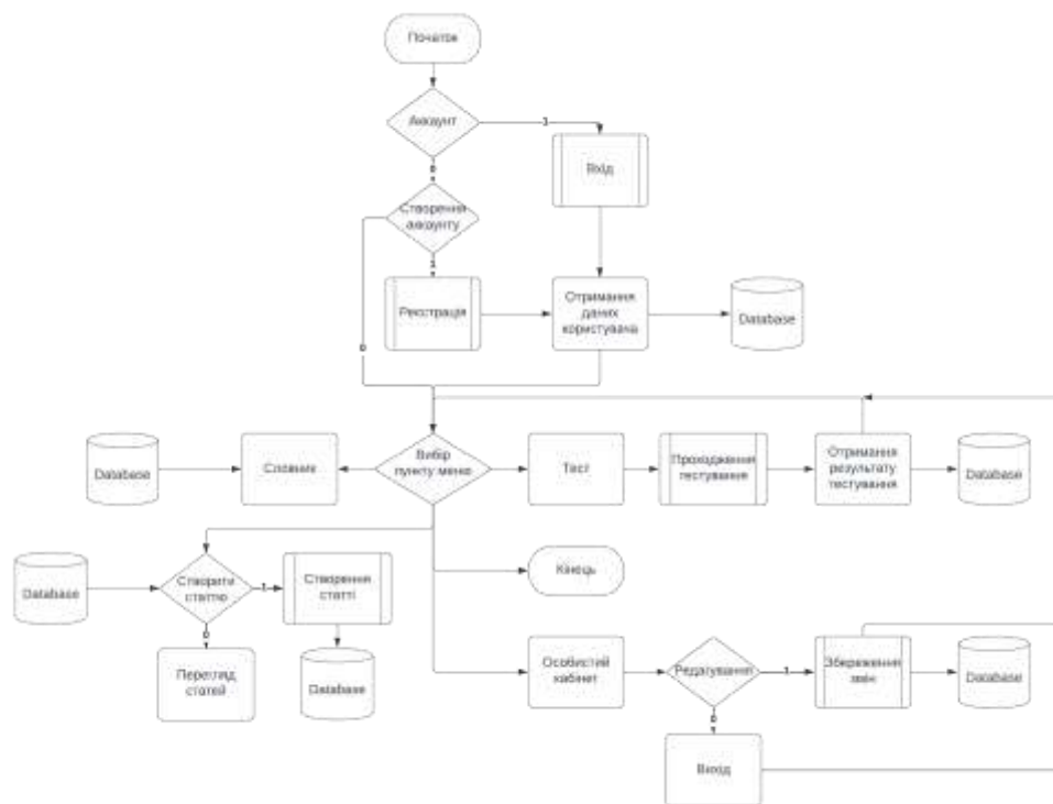
Рис. 2. Загальна блок-схема роботи алгоритму платформи

Після проходження авторизації з пункту меню користувач може обрати необхідну йому функцію. Зокрема користувач може пройти тестування, знайти необхідні йому слова в словнику, створити статтю з поясненням граматики або почитати уже існуючу.