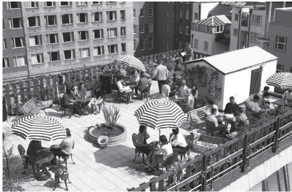
Рис. 2. Сад на даху в м. Чикаго

Ідеєю зелених дахів захопилась багато архітекторів XIX – XX ст. Американський архітектор Ф.Л. Райт в 1914 р. розробив проект за яким був побудований на півночі США в Чикаго ресторан з відкритими дахами, які забезпечували широку панораму і представляли собою справжній сад на даху. Сьогодні в Чикаго існує чимало садів на дахах звичайних житлових будівель, магазинів, кафе, розважальних центрів і навіть помітна висока конкуренція відкриття компаній, які займаються створенням і дизайном садів на дахах (рис. 2).