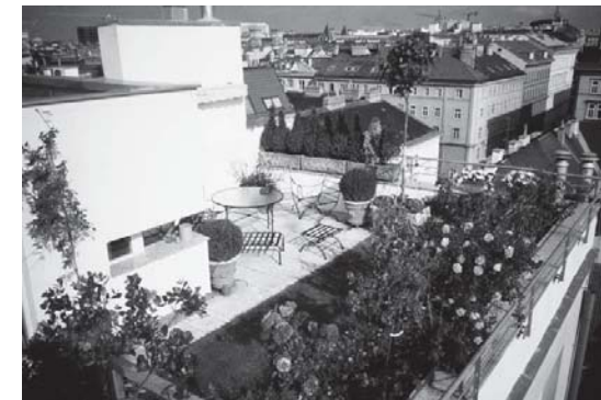
Рис. 1. Приклад озеленення дахів в Швейцарії

Сучасні сади на дахах. Архітектори всіх часів і народів мають тягу до прекрасного, але першість в створенні спеціалізованих будівельних технологій, конструкцій і покрівельних матеріалів, які застосовуються в будівництві садів на дахах спеціалісти віддають Німеччині. Німці приділяють величезне значення енергозберігаючим технологіям та екологічному проектуванню. З цією метою в країні, при будівництві нової будівлі, вимагають розробку проекту озеленення даху, а за відсутність газону чи саду на даху німецькі домовласники обкладаються додатковим податком. Подібні норми прийняли і японці, в яких при будівництві будівлі з дахом площею більшою за 100 м 2 , власники зобов'язані створювати зелені оазиси на даху. В Швейцарії ¼ всіх плоских дахів будівель складають зелені газони, а справжні сади мають більшість ресторанів та деякі компанії (рис. 1).