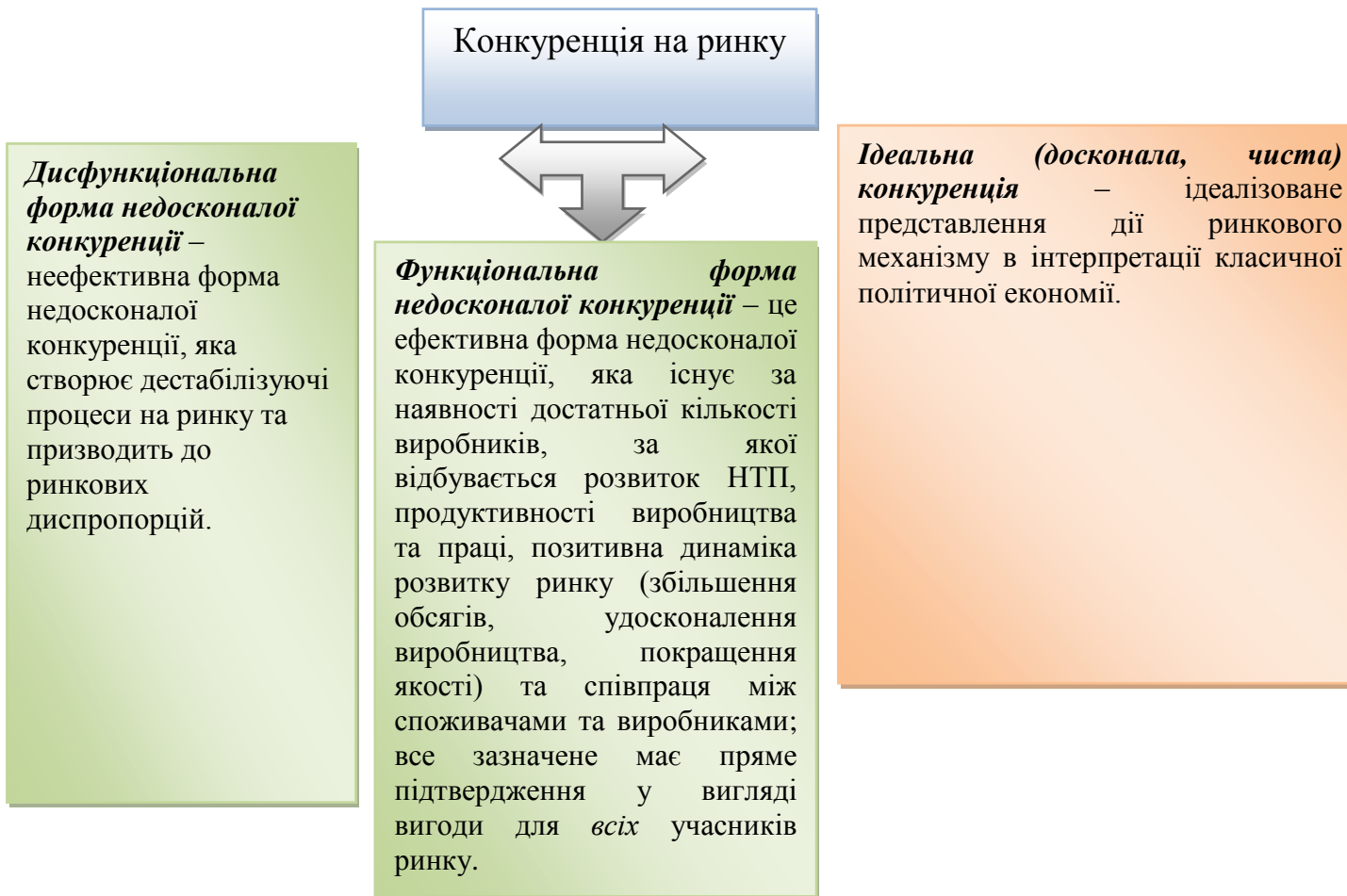
Рис. 1. Авторське трактування категорій конкуренції в рамках загальної теорії недосконалої конкуренції