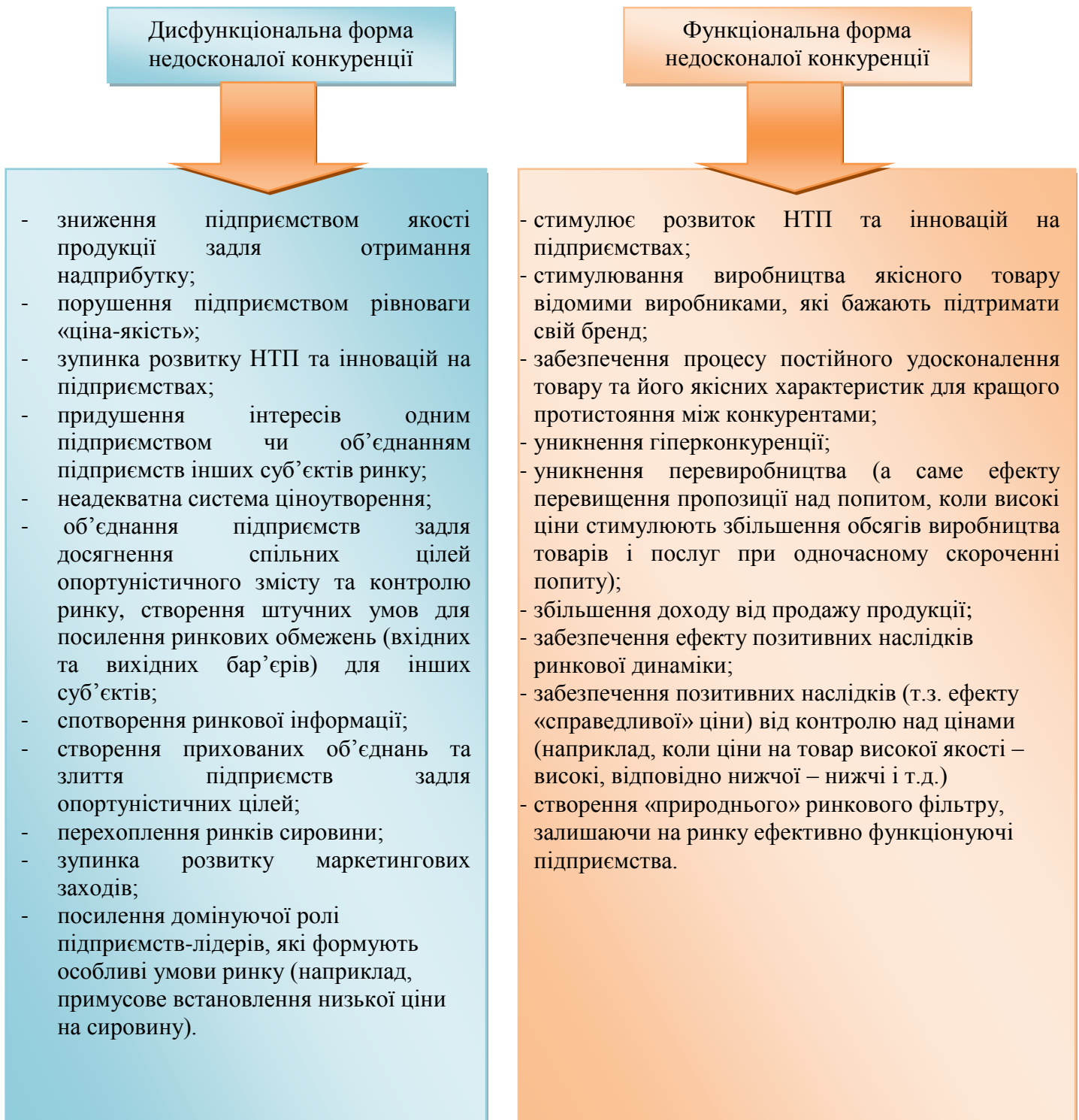
Рис. 3. Ознаки дисфункціональної та функціональної форм недосконалої конкуренції