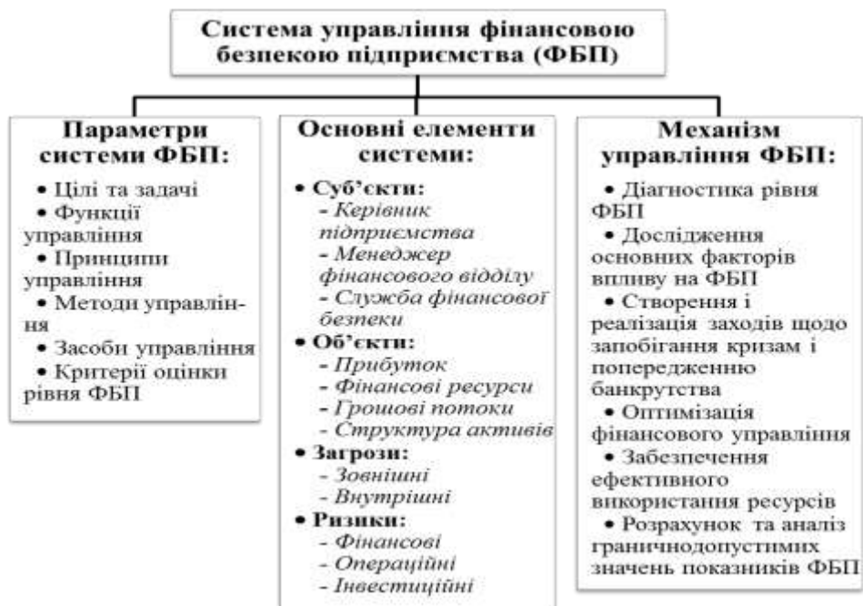
Рис. 1. Управління фінансовою безпекою підприємства