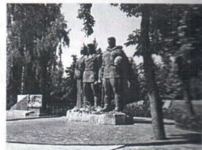
Рис.5 – Меморіальний комплекс слави