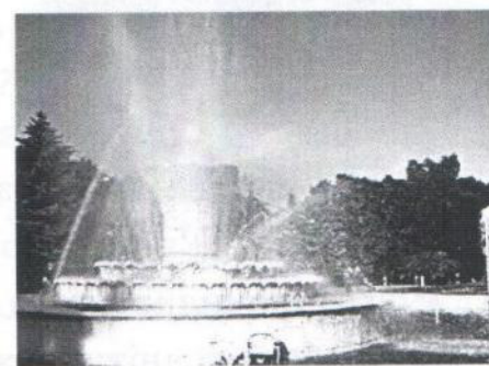
Рис.3 – Фонтан у центральному парку

В місті є багато діючих фонтанів. Єдиним найстарішим є фонтан у Центральному міському парку імені Горького (Рис.3). Реставрація цього фонтану закінчилась кілька років назад. Новий матеріал, який використовувався при реконструкції, водовідштовхуючий і стійкий до перепадів температури. Також фонтан обладнаний сучасним підсвічуванням з великою кількістю світлодіодів, як і було в радянські часи.