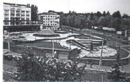
Рис.4-Комплекс фонтану біля Універмагу

- при вході в парк знаходиться пам'ятник Максиму Горькому;