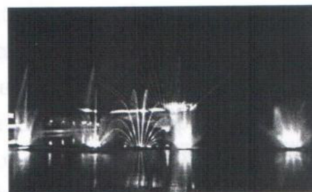
Рис.2 – Фонтан ROSHEN

Вінницю називають - містом фонтанів. Головною прикрасою міста і найбільшим плаваючим фонтаном Європи є фонтан ROSHEN (Рис.2). Він побудований в руслі річки Південний Буг. Згідно з технічними характеристиками висота струменя фонтану досягає 60 метрів, фронтальний розліт води - 140 метрів. Фонтан ROSHEN складається з рухомих елементів: на кожній з 4 систем UFO з електроприводом прибудовані 40 форсунок і 11 маленьких фонтанчиків, які обертаються навколо своїх осей. Підтримка м'якості рухів здійснюється перетворювачами частоти Hitachi. Спроекували постачання силової мережі фонтану у Вінницькому проектному інституті, а сам фонтан розробив інженер компанії Emotion Media Factory Ральф Доу. Фонтан у Вінниці порівнюють з фонтаном в Еміраті Дубаї.