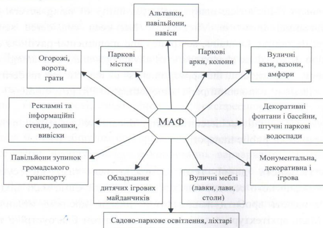
Рис. 1 – Узагальнена класифікація малих архітектурних форм

Мала архітектурна форма – це невелика споруда декоративного, допоміжного чи іншого призначення, що використовується для покращення естетичного вигляду громадських місць і міських об'єктів, організації простору та доповнює композицію будинків, будівель, їх комплексів [1]. За тлумачним словником малі архітектурні форми (МАФ) – це в ландшафтній архітектурі і садово-парковому мистецтві: допоміжні архітектурні споруди, обладнання та художньо-декоративні елементи, що володіють власними простими функціями і доповнюють загальну композицію архітектурного ансамблю забудови.