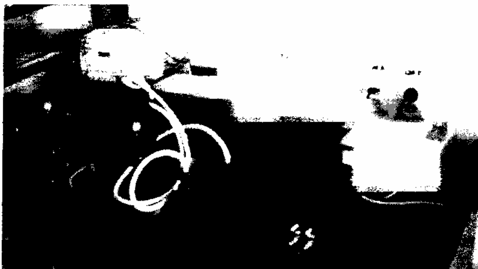
Рисунок 1 - Комп'ютерно-вимірювальна система діагностики стану нормальних і патологічних біотканин

Дослідження спектрів дифузного відбивання нормальних біотканин проводились на групі здорових реципієнтів – студентах-екологів ВНТУ у ході практичних робіт з дисципліни “Основи науково-дослідної роботи”, студентах ВНМУ ім.М.Пирогова у ході їх практики у Інституті реабілітації інвалідів. Для вивчення вікових змін у спектрах дифузного відбивання нормальних біотканин проводились дослідження на співробітниках кафедри ХЕБ ВНТУ, співробітниках Інституту реабілітації інвалідів. Дослідження спектрів дифузного відбивання патологічних біотканин проводились на групі хворих системним червоним вовчаком, хворих з ампутованими кінцівками, хворих з травмами та гематомами різного роду, онкохворих [3]. Також проводились дослідження спектрів дифузного відбивання фрагментів біотканин наданих кафедрою судмедекспертизи ВНМУ.