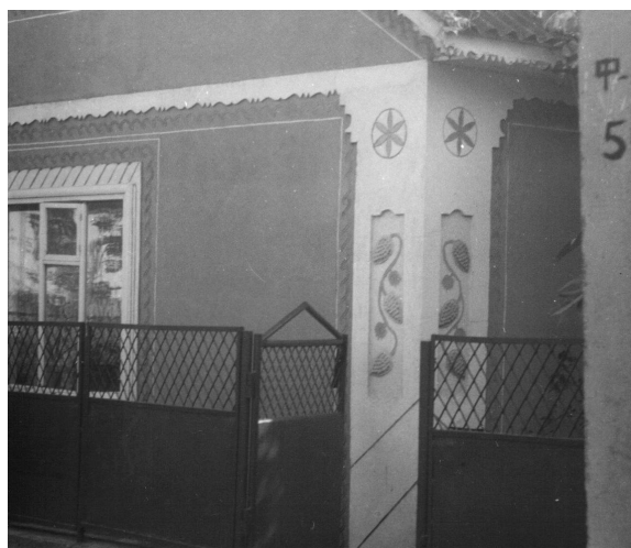
Рис. 4. Характерне оздоблення пілястри в Шаргородському районі