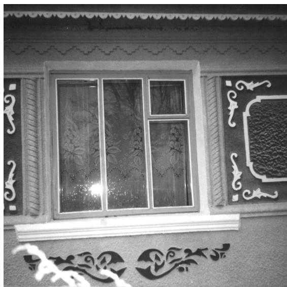
Рис. 5. Декоративна штукатурка у с. Березівка Могилів-Подільського району

При цементно-піщаному оштукатурюванні стіни розповсюдження набула технологія “під гребінець”. “Гребінець” виготовляється з дерева або гуми і являє собою пластинку з зубчиками. У Чернівецькому та Томашпільському районах в результаті обробки таким інструментом з’являються хвилеподібні боріздки глибиною 3-4 мм, які надають неповторності і вишуканості стіні (рис. 6). В той же час пілястри зі смаком трактуються рослинним орнаментом на тему виноградної лози. При цьому застосовуються так звані “штампи”, що набули широкого розповсюдження на півдні Вінницької області.