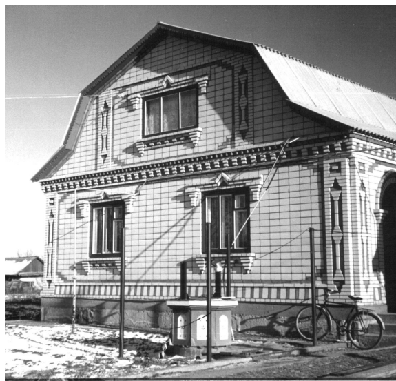
Рис. 10. Характерний фасад житлового будинку оздобленого силікатною та керамічною цеглою “під розшивку”. (с. Сокілець)

В багатьох селах Теплицького, Бершадського та Гайсинського районів побутує спосіб орнаментальної пластики, виконаний в цеглі. Значну площу стіни займає зображення стилізованої квітки, кольору кераміки на фоні білої силікатної стіни. Така трактовка з'явилась в останньому десятиріччі (рис. 12).