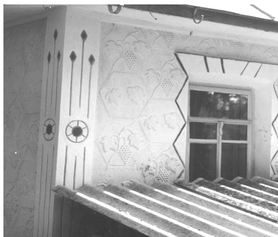
Рис. 8. Пілястра, декорована вертикальними фільонками