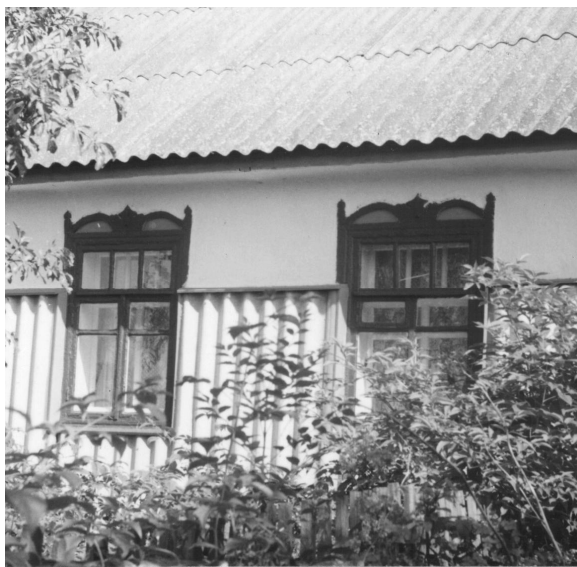
Рис. 9. Трактовка стіни у с. Пикові, захищеної від вологи хвилястими азбоцементними листами

На рис. 10 зображено характерний будинок з силікатної та керамічної цегли, збудований в с. Сокілець Немирівського району. Впадає в око велика кількість елементів декоративної пластики, майстерно виконаної навколо вікон вхідної частини на пілястрах, карнизі та мансардній частині. Можна сперечатися про мистецьку довершеність цегляної пластики, але безперечним є одне – такий спосіб пластичного оздоблення є кроком вперед у бажанні селянина зробити свою оселю неповторною та красивою. Така пластична трактовка має велику кількість варіантів, які видозмінюються в різних місцевостях (рис. 11).