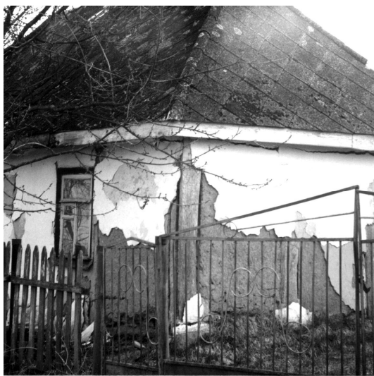
Рис. 1. Старий будинок у с. Межиріві, де видно особливості каркасно-глинобитної схеми стіни

Зовні і всередині стіни вирівнювали глиною, змішаною з половиною. Робили це руками, тому форми були округлені. Зовні стіни оздоблювались пілястрами, часом фігурними формами. Пластична обробка фасадів підкреслює та виявляє конструктивну схему стіни. Витончені пілястри, що відповідають стійкам каркасу та характерне “подільське” їх завершення, надають архітектурному вирішенню житлових будинків яскраву самобутність та архітектурну довершеність (рис. 4).