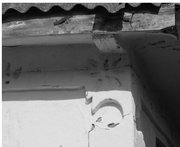
Рис. 7. Мотиви барокко в народній архітектурі

Пілястри є тектонічним елементом стіни і виникають вони, як правило, в місцях вертикальних елементів каркасу. Кутові пілястри за рахунок їх товщини зменшують промерзання кутів будинку, виконуючи утилітарне призначення. Якщо пілястри робляться широкими, їх, як правило, розбивають профільованими фільонками, що мають різноманітні обриси (рис. 8).