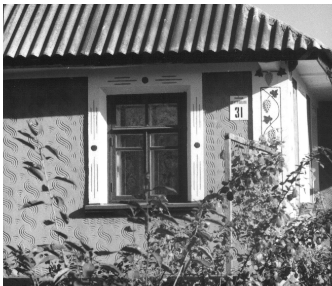
Рис. 6. Декоративна пластика стіни, виготовлена технологічним способом “під гребінець”, у Чернівецькому районі

Пластична обробка стін у більшості регіонів Вінницької області несе в собі сліди впливу монументальної архітектури і в тому числі архітектури барокко, риси якої відслідковуються в багатьох спорудах міст та містечок цього регіону (рис. 7).