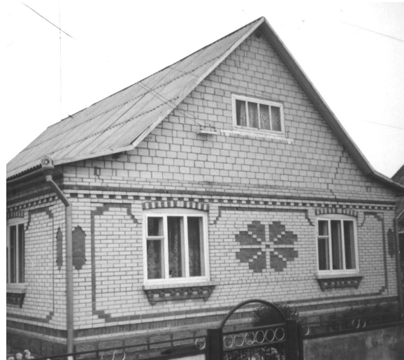
Рис. 12. Варіант фасаду оздобленого орнаментальною пластинкою в цеглі (с. Росоша, Теплицького району)

Важливою особливістю народних архітектурних традицій є їх постійні зміни під дією зовнішніх факторів та творчої діяльності людини, що забезпечує поступальність культурного розвитку суспільства та вдосконалення архітектури. Таким чином, традиції в народному зодчестві не є чимось незмінним, константним – вони знаходяться в постійному і безперервному русі та розвитку.