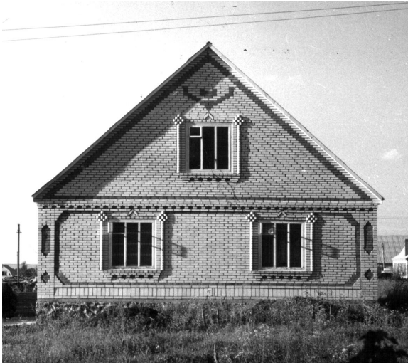
Рис. 11. Сучасний житловий будинок м. Немирів