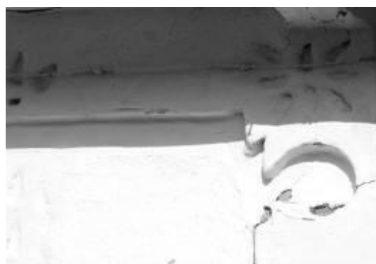
Рис. 4. Капітель, виконана з глини в селі Івонівці