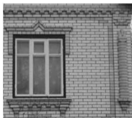
Рис. 16. Пластика цегляної кладки в сучасному селянському житлі