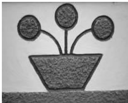
←Рис. 1. Мотив вазона в пластичному оздобленні фасаду