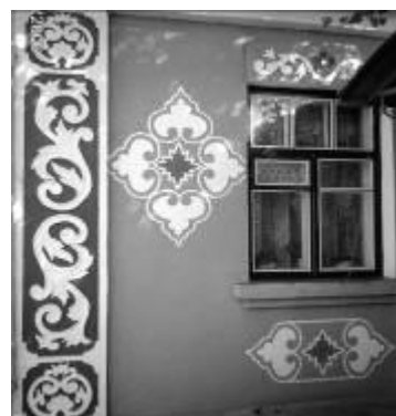
Рис. 13. Застосування кольору при техніці “сграфіто” в с. Поташня