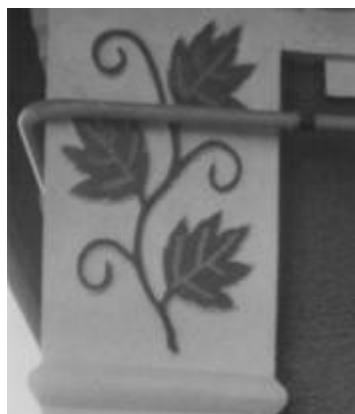
Рис. 9. Застосування рослинного мотиву при пластичній обробці капітелі