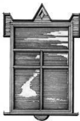
Рис. 15. Використання дерев'яних наличників як пластики