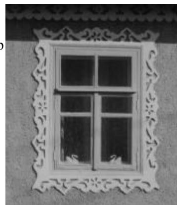
Рис. 11. Мережана пластика при оздобленні вікна в селі Мурафа