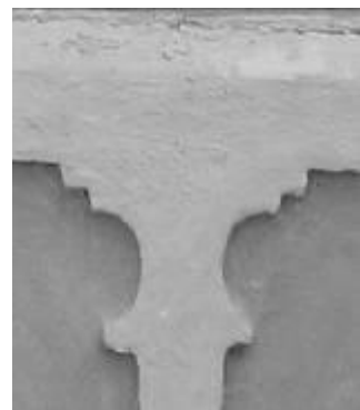
Рис. 8. Характерне пластичне вирішення пілястри, що переходить у карниз (південь Поділля) →