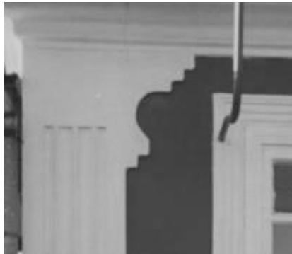
←Рис. 5. Трактуння колони та капітелі у с. Березівка