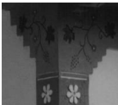
←Рис. 7. Багатопланова пластична композиція (село Росоша)