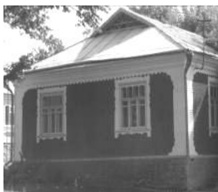
Рис. 14. Контрастне співвідношення кольорів при оздобленні фасаду