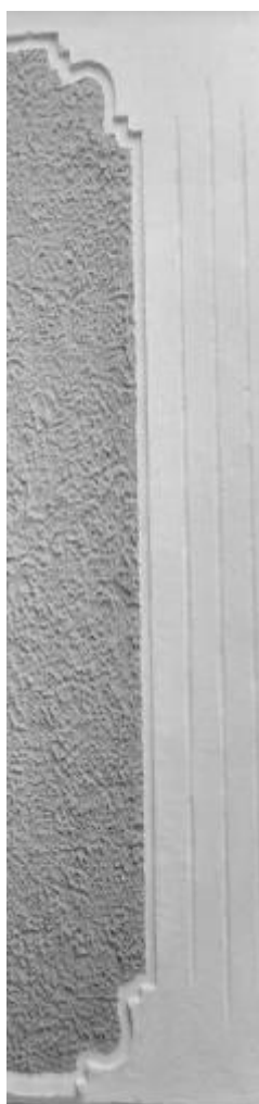
Рис. 10. Розвинена пластики при трактуванні пілястр (с. Дзигівка)