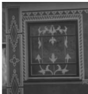
Рис. 12. Техніка “сграфіто” в селі Борівка