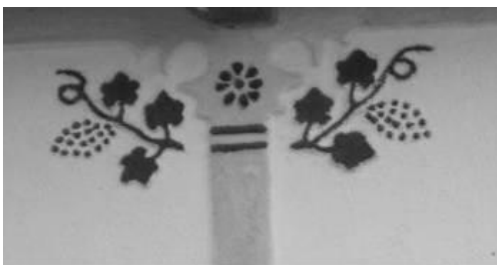
Рис. 3. Зображення виноградної лози, що прикрашає капітель колони