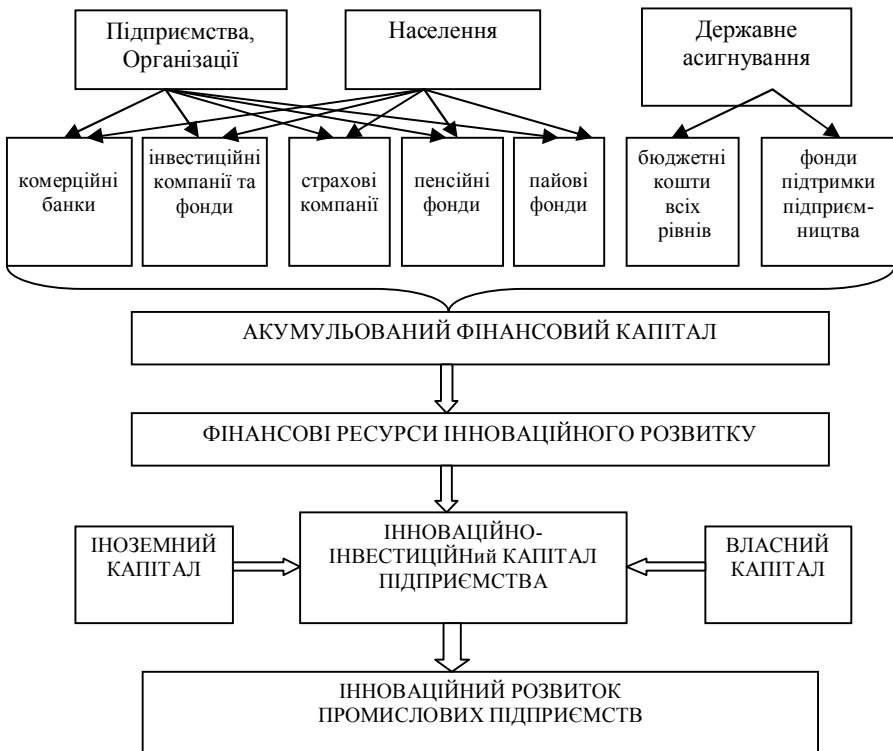
Рисунок 1. Формування джерел фінансування інноваційного розвитку підприємств

На рис. 1 схематично представлені джерела фінансування інноваційної діяльності промислових підприємств.