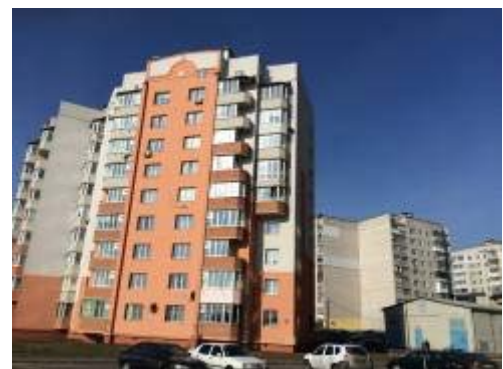
Рисунок 10 – Приклади самочинного переобладнання технічного поверху

6. Порушення ведення журналів виконання будівельних робіт