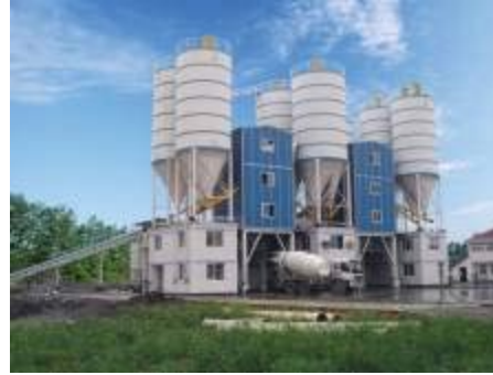
Рисунок 4 – а) Група багатоповерхівок; б) Завод