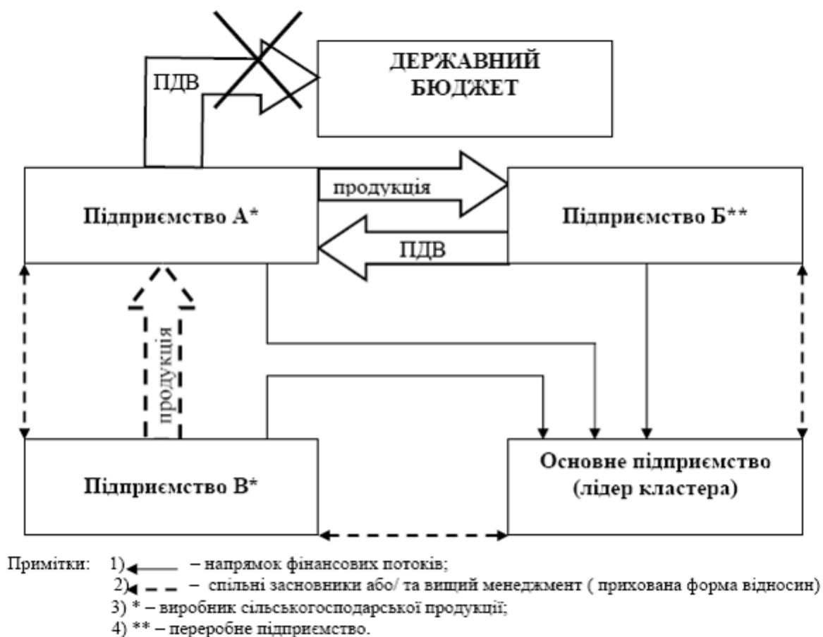
Рис. 3. Схема (модель) "мінімізації" податків шляхом створення кластерів в АПК