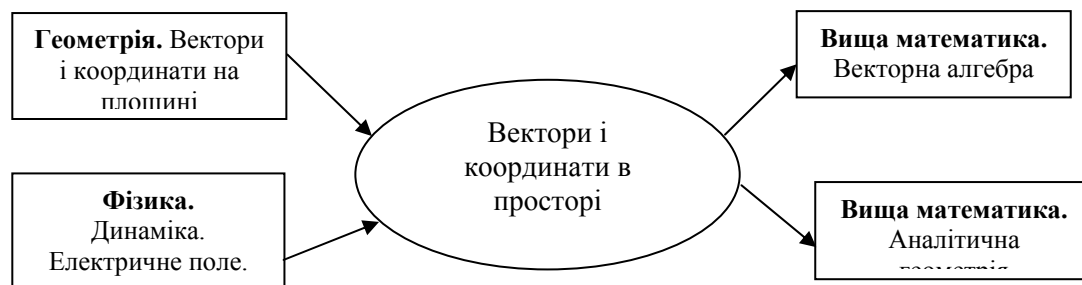
Рис.1 – Реалізація міжпредметних зв'язків

Саме тому, під час занять з вищої математики ми намагаємось під час вивчення нової теми показати студентам взаємозв'язок її з іншими дисциплінами і таким чином, довести необхідність її вивчення для подальшого професійного оволодіння майбутнім фахівцем своєї спеціальності. Наприклад, проілюструємо міжпредметні зв'язки в процесі вивчення теми «Вектори і координати в просторі».