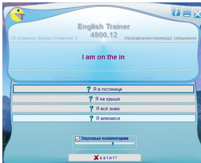
Рис.3. Работа программного dodatku «ETrainer 4800»

Загальним недоліком двох попередніх додатків є відсутність можливості вивчення правильної вимови іноземних слів.