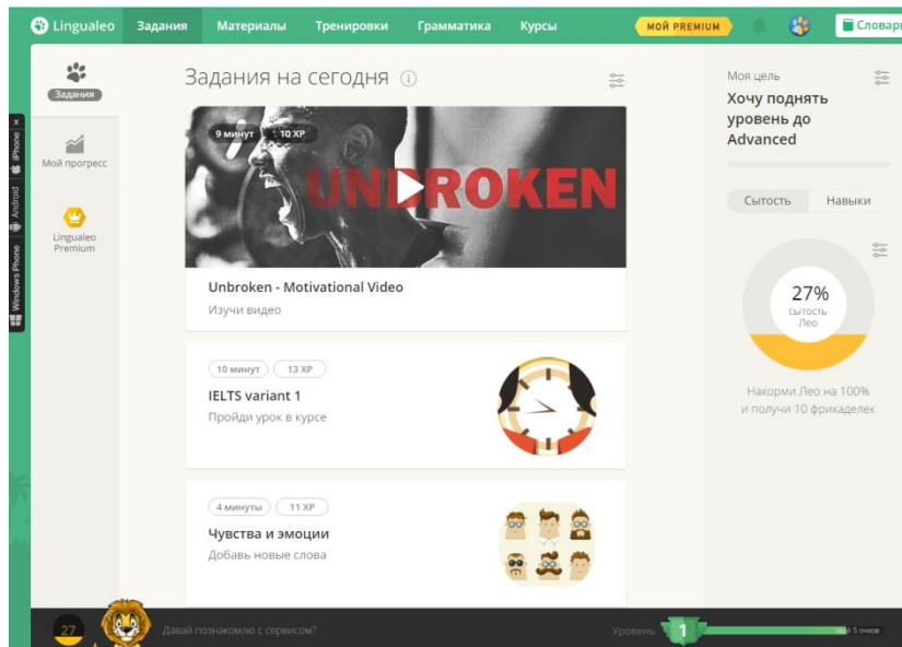
Рис.1. Работа сервису «LinguaLeo»

Одна з основних проблем LinguaLeo – низький рівень залученості: всього 4% користувачів мають платні акаунти і тільки близько 10-30% купують «Золотий статус» та інші опції повторно. За оцінкою експертів, на початок 2013 року LinguaLeo щодня користувалися не більше 1% користувачів або близько 100 тисяч чоловік. Це пов'язано з тим, що більшості користувачів швидко втрачає інтерес до самоосвіти, незважаючи на гейміфікацію процесу. Зважаючи на останнє, доцільно було б розробити програмний продукт, робота якого проходила б паралельно з роботою користувача за комп'ютером.