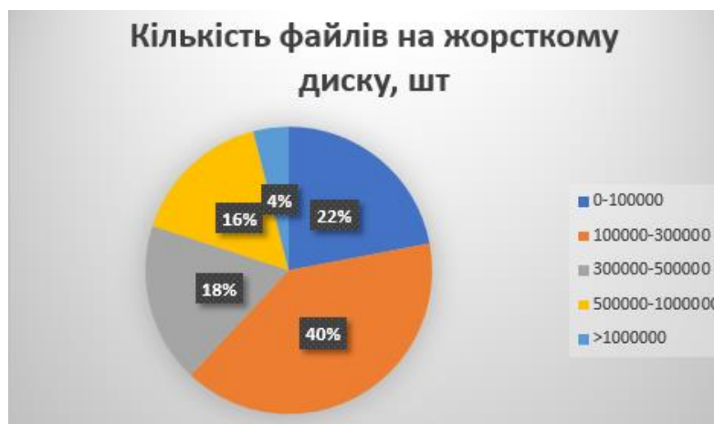
Рис. 1. Діаграма кількості файлів на жорсткому диску

Пошук даних на жорсткому диску на даний час суттєво впливає на швидкість, ефективність та комфортність роботи користувача при користуванні ОС. З кожним роком жорсткі диски отримують все більший об'єм пам'яті – тобто зростає кількість файлів, яку вони зберігають. На рисунку 1 відображена діаграма розподілу середньої кількості файлів на жорсткому диску [1].