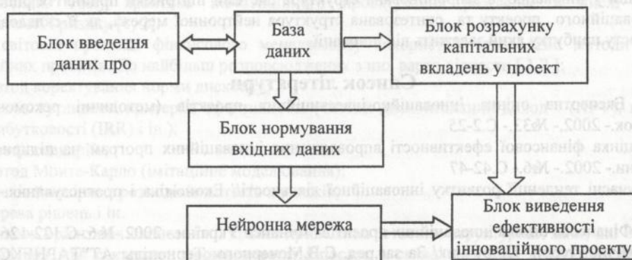
Рисунок 1 - Структурна схема системи підтримки прийняття рішень про ефективність інноваційного проекту

Структура системи підтримки прийняття рішень зображена на рис.1.