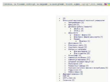
Рис. 2 Колекції навчального репозиторію

Такий інструментарій разом з онлайн-спільнотою створення нормативних та розпорядчих документів за допомогою інструментів колективної взаємодії дозволить збільшити продуктивність праці всіх учасників організації освітньої діяльності.