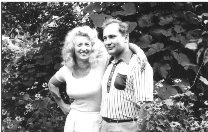
З дружиною на малій батьківщині, м. Донецьк, 1977 р.