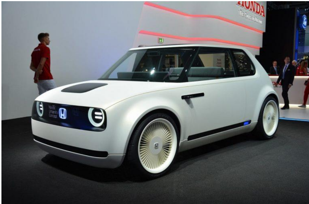
Рисунок 4 – Honda Urban EV

Компанія Jaguar прийняла рішення електрифікувати всі свої моделі автомобілів до 2020 року. Jaguar i-Pace (рис.5) буде самою ранньою версією яка вийде вже в 2018 році. Цей позашляховик оснащений акумулятором потужністю 90 кВт і виробляє 400 кінських сил.