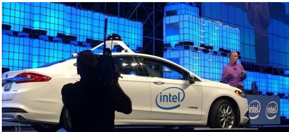
Рисунок 6 – Презентація нового автомобіля Intel

Зокрема, машини нового покоління обладнають декількома камерами – як ззаду та спереду, так і з обох боків автомобіля. Їхня взаємодія дасть можливість пересуватися містом без наявності водія, посиливши при цьому безпеку руху.