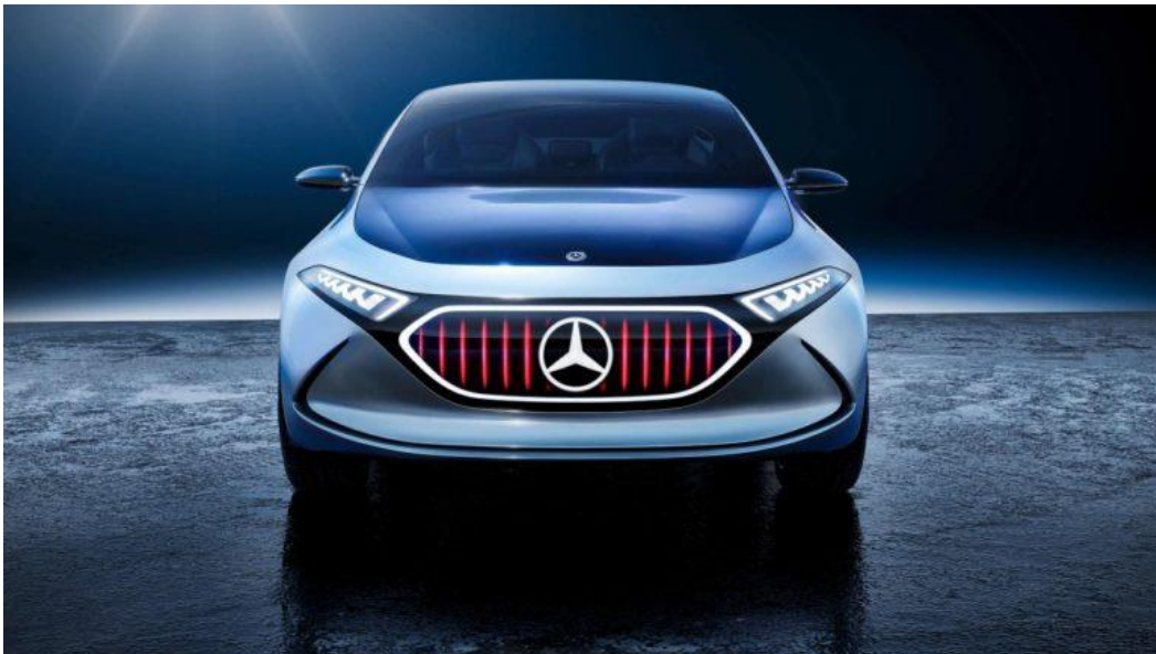
Рисунок 2 – Mercedes Benz EQA

Німецький виробник автомобілів недавно показав свій компактний позашляховик. Їхній автомобіль буде буквально напханий різними технологічними новинками включаючи сенсорні екрани. Акумулятор 60 кВт буде підтримувати бездротову зарядку і зможе рухати ваш автомобіль цілих 250 миль (рис. 2).