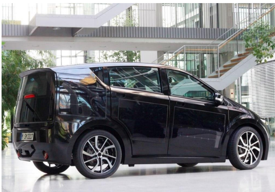
Рисунок 7 – Sono Motors «сонячний» електромобіль з двома варіантами акумуляторних батарей

Три інженера з Мюнхена займалися розробкою доступного електромобіля на сонячних батареях протягом трьох років. Кошти на інженерно-конструкторські роботи німці залучили за допомогою краудфандінгової кампанії, зібравши за кілька місяців понад 600 тисяч євро на будівництво першого ходового прототипу і його випробування. В результаті вийшов електромобіль під назвою Sion, обладнаний сонячними панелями [22].