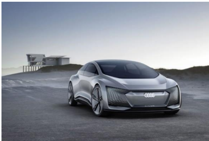
Рисунок 1 – Audi-Aicon

Концепт нового електричного автомобіля від компанії Audi, який на одному заряді повинен проїхати 500 миль. Такий прогноз говорить про те, що це як і раніше концепція, над якою все ще працює Audi (рис.1).