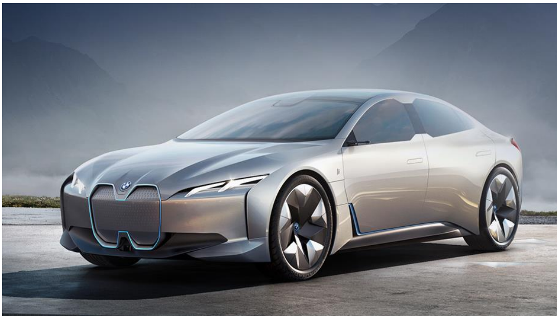
Рисунок 3 – BMW i-Vision Dynamics

Один з самих популярних концептів у Франкфуртському автосалоні 2017. Цей шикарний седан здатний конкурувати з фаворитом ринка електромобілів Tesla. Автомобіль має максимальну швидкість 120 миль на годину і діапазон 373 миль за заряд. Він ще не надійшов у продаж, але коли це трапиться він приєднається до електромобілів і3 і і8 компанії BMW (рис. 3).