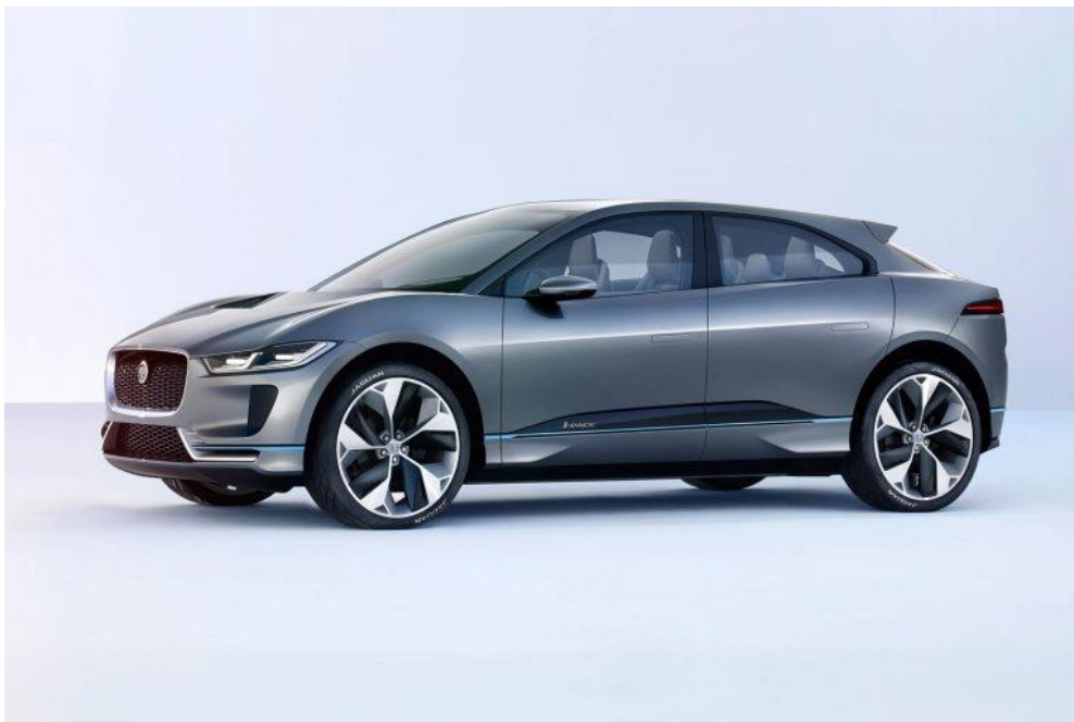
Рисунок 5 – Jaguar i-Pace

Компанія Jaguar прийняла рішення електрифікувати всі свої моделі автомобілів до 2020 року. Jaguar i-Pace (рис.5) буде самою ранньою версією яка вийде вже в 2018 році. Цей позашляховик оснащений акумулятором потужністю 90 кВт і виробляє 400 кінських сил.