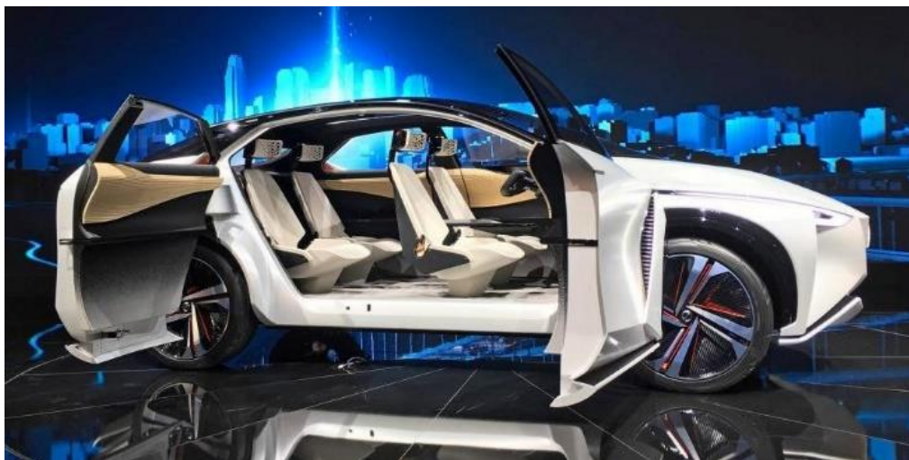
Рисунок 5 – Nissan Leaf

Слідом за виставою, що пройшла в вересні світовою прем'єрою нового Nissan Leaf автовиробник представив в Токіо ІМх: 4-місний електрокросовер, який може управлятися повністю автономно і проїхати на одній зарядці більше 600 км (по японському стандарту JC08).