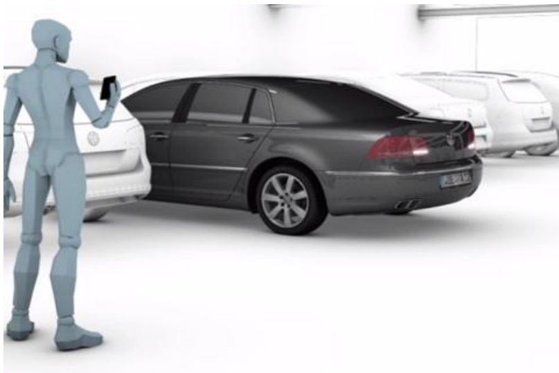
Рисунок 4 – Асистент паркування Volkswagen

Парковка без водія. Асистенти парковки є ще одним кроком до перекладу автомобілів на автономне пересування, але поки їх здатності обмежуються паралельним і перпендикулярним паркуванням при обов'язковій присутності водія. Ford і Volkswagen розробили системи, які дозволяють поставити автомобіль на вибране місце, коли всередині нього нікого немає. Це може бути дуже зручно в ситуації, коли місця для машини вистачає, а ось відкрити двері і вийти вже неможливо через обмежений простір. Водієві пропонується виставити автомобіль так, щоб йому потрібно було переміщатися тільки вперед або назад, і за допомогою пульта управління перемістити машину на місце. При цьому система самостійно перемкне передачі, заведе або заглушить двигун і включить гальмо стоянки [9].