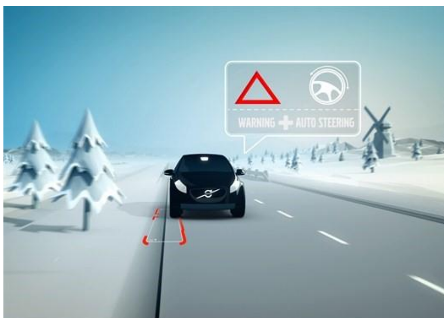
Рисунок 1 – Системи безпеки Volvo

У Volvo схожа функція робить акцент на сприйнятті узбіччя. За статистикою, певна кількість аварій трапляється, коли автомобіль з'їжджає з дороги і під колесами виявляється поверхня з різним коефіцієнтом зчеплення. Для того щоб цього не траплялося, датчики зчитують показання про відстань до краю проїзної частини та попереджають водія про небезпеку.