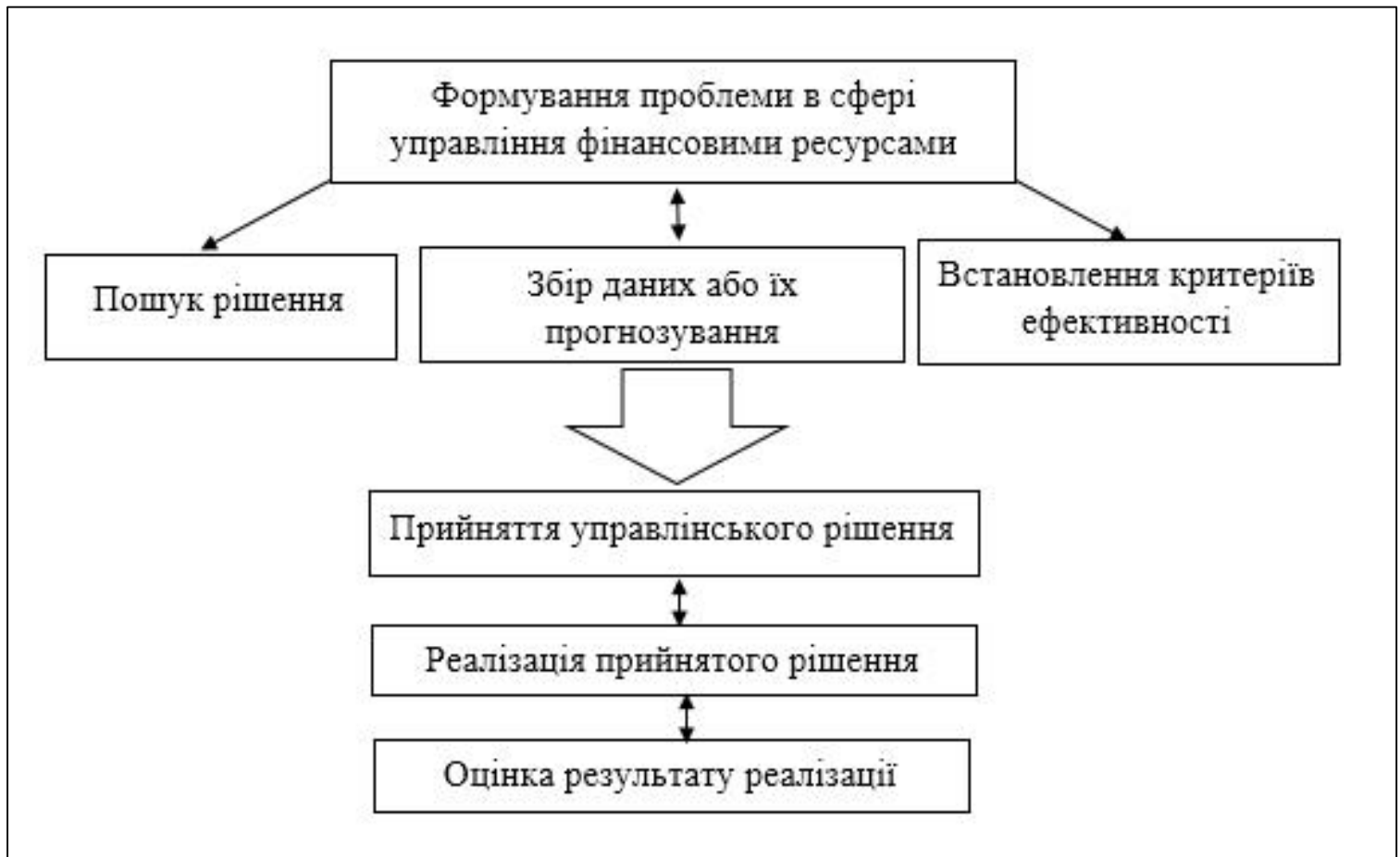
Рисунок 1.1 Схеми прийняття рішень з управління фінансовими ресурсами