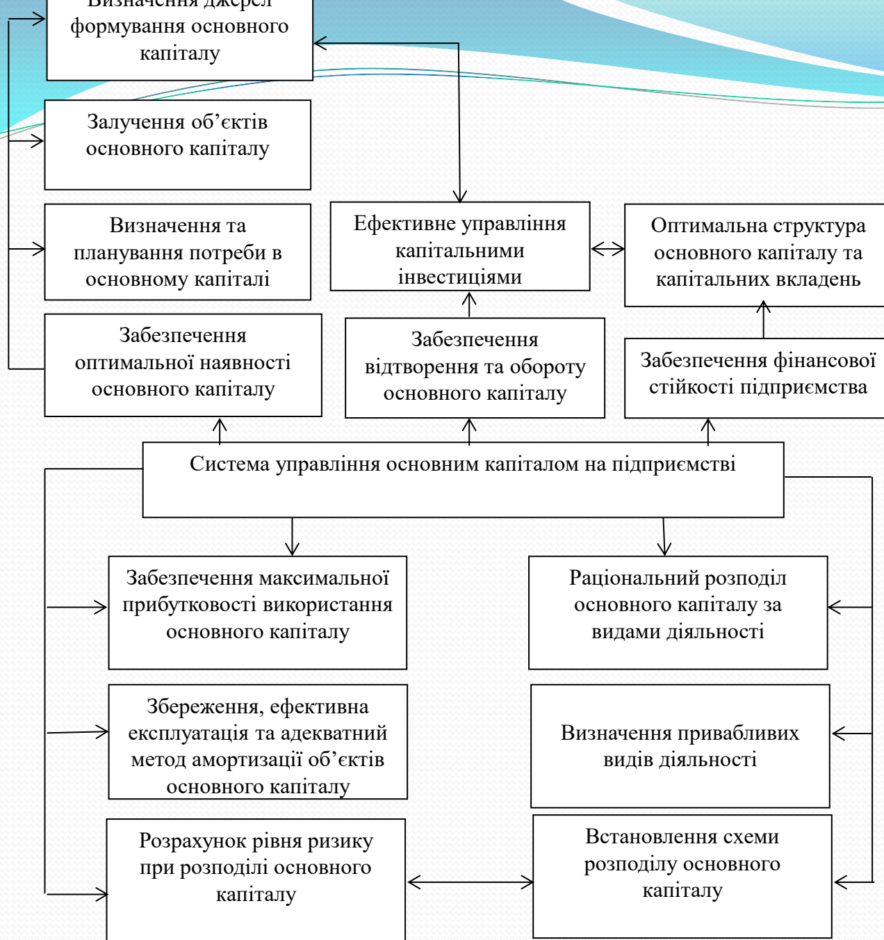
Рисунок 1 - Напрями формування системи управління основним капіталом підприємства