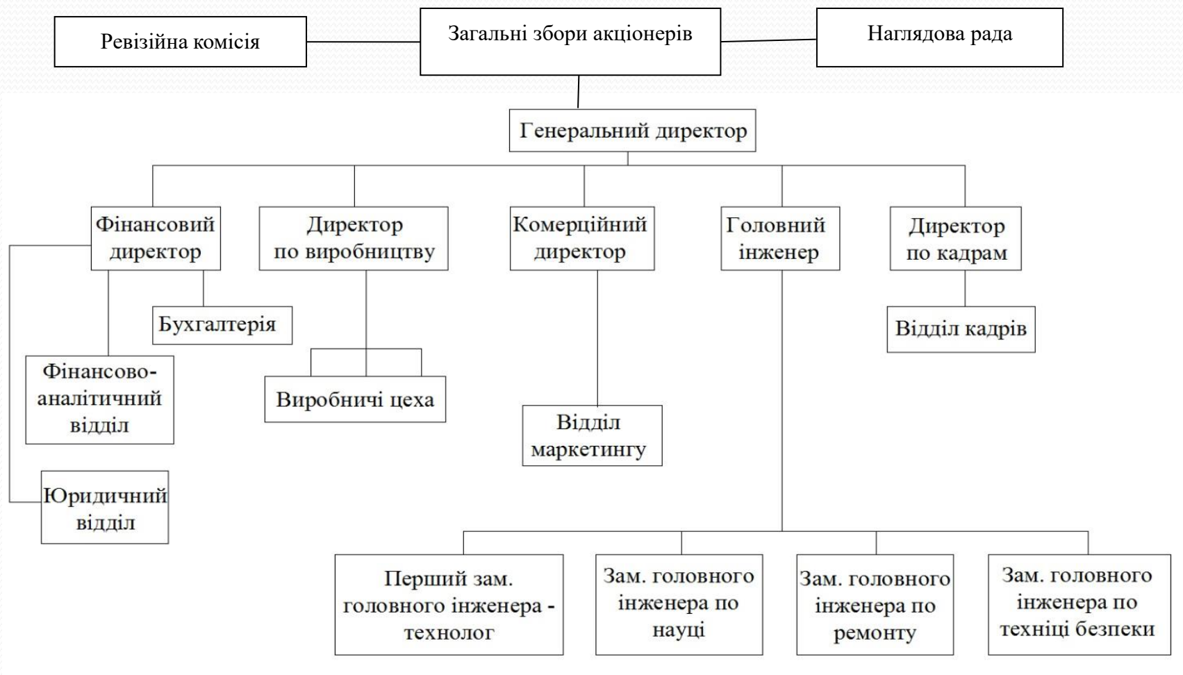
Рисунок 3 - Організаційна структура управління ПАТ «Вапнярський молокозавод»