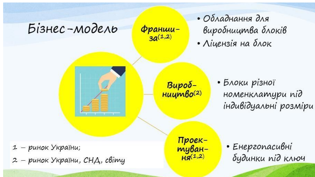
Рис. 3 Запропонована бізнес-модель

Основна бізнес-модель для монетизації розробленого авторами енергоефективного теплоблоку наведена на рис. 3.