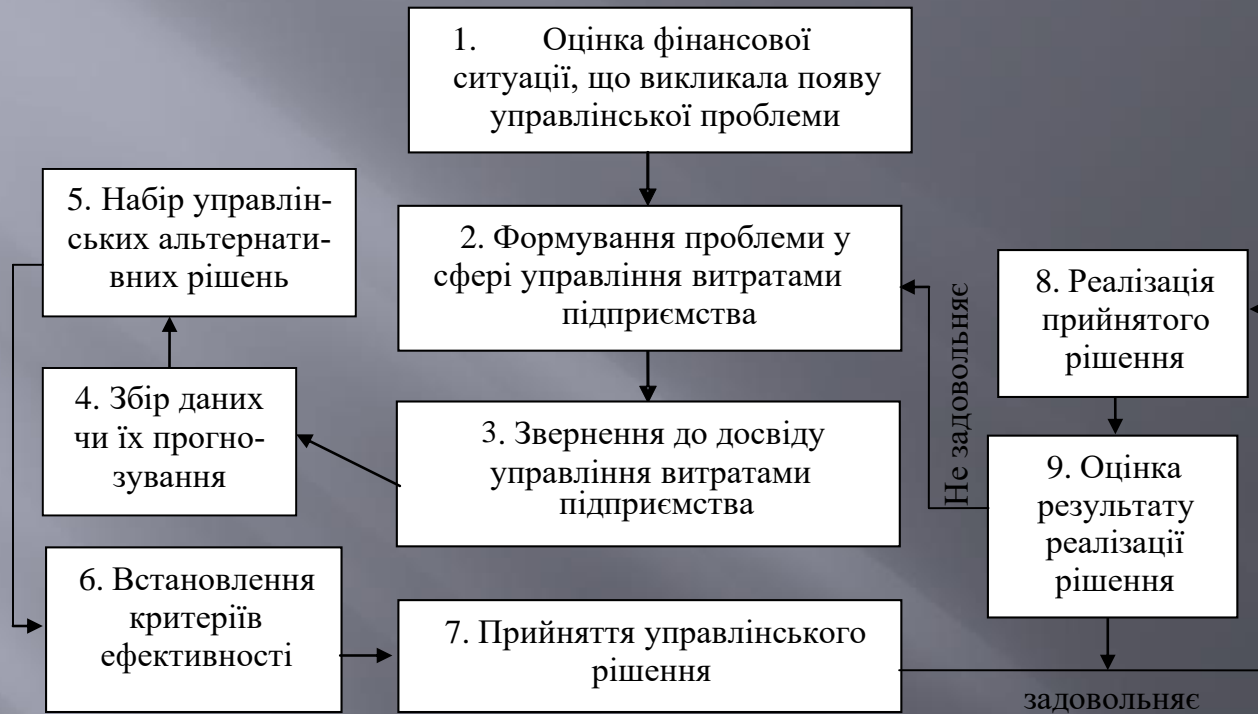
Рисунок 2 – Схема ефективного управління витратами підприємств у ринковій економіці України