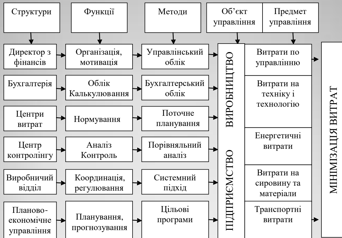
Рисунок 1 – Основні елементи організаційно-інформаційної моделі комплексної системи управління витратами