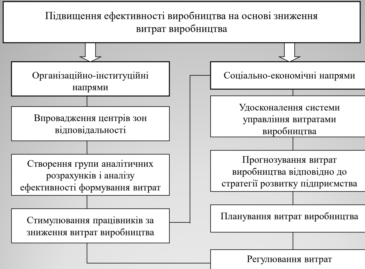
Рисунок 7 – Основні напрями удосконалення системи управління витратами виробництва на підприємствах легкої промисловості на основі інституційного підходу