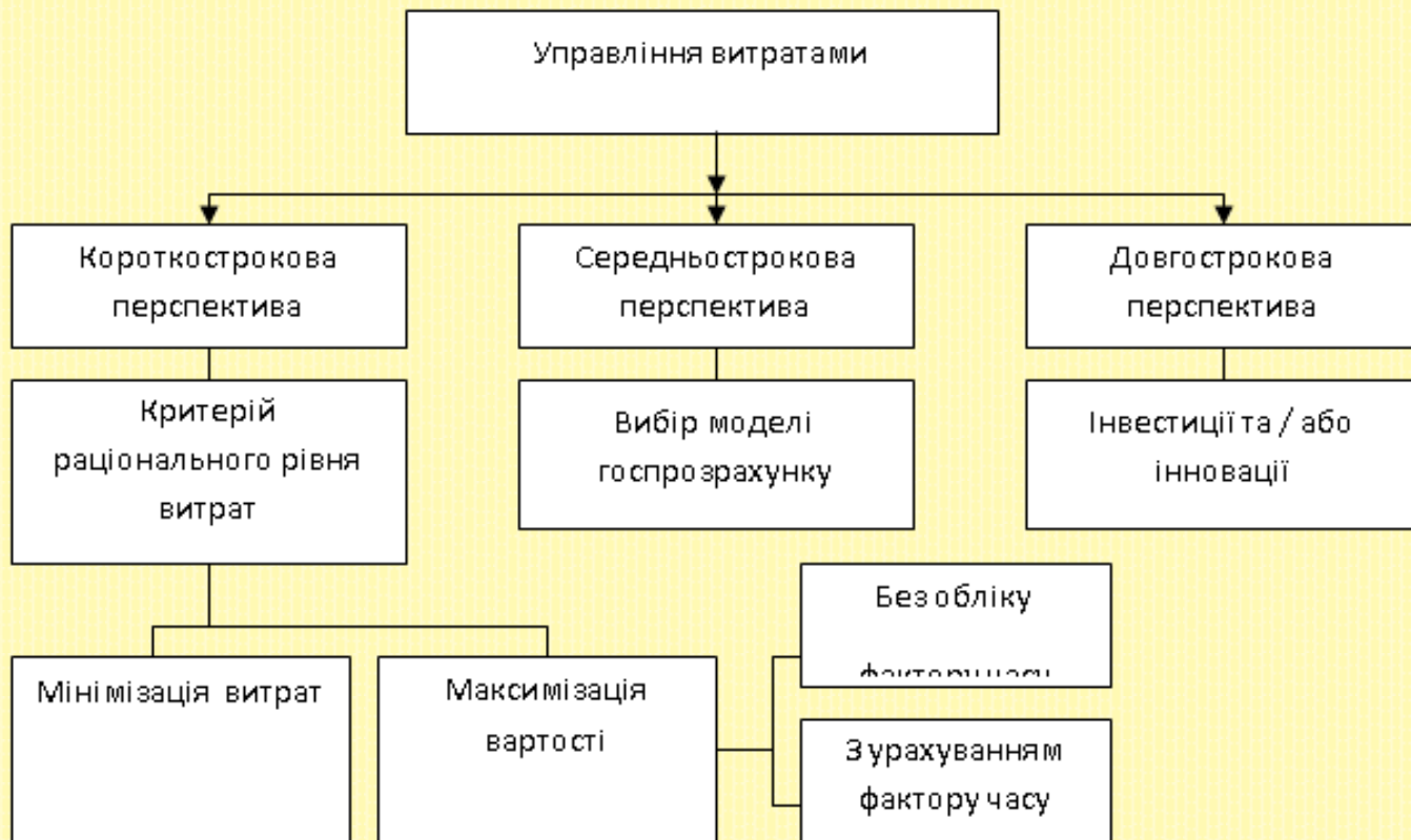
Рисунок 3 – Типологія підходів управління витратами з урахуванням перспективного розвитку підприємства