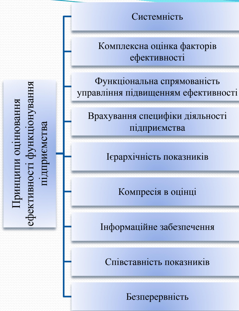
Рисунок 3— Принципи оцінювання ефективності функціонування підприємства