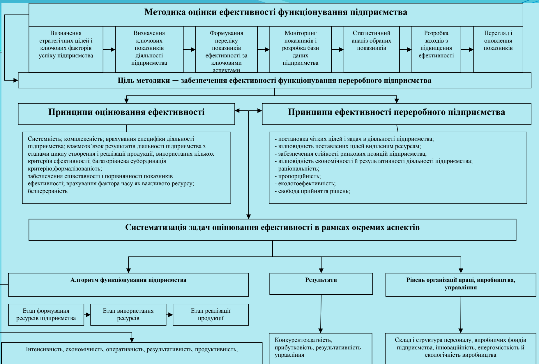
Рисунок 5 - Методика оцінки ефективності функціонування підприємства