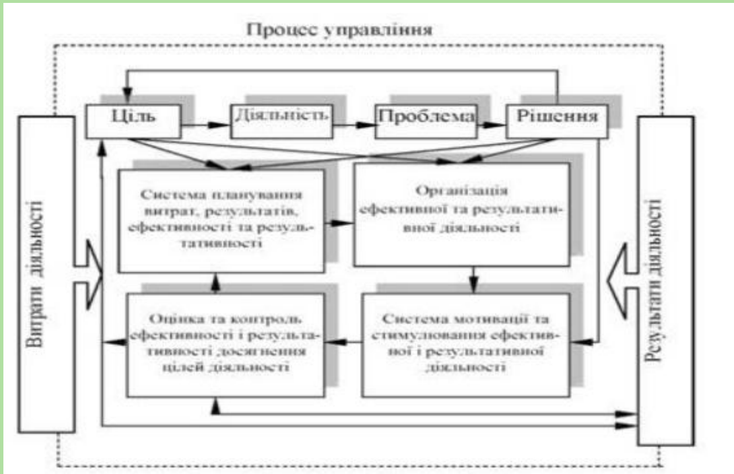
Рисунок 2 - Система управління ефективністю та результативністю діяльності організації