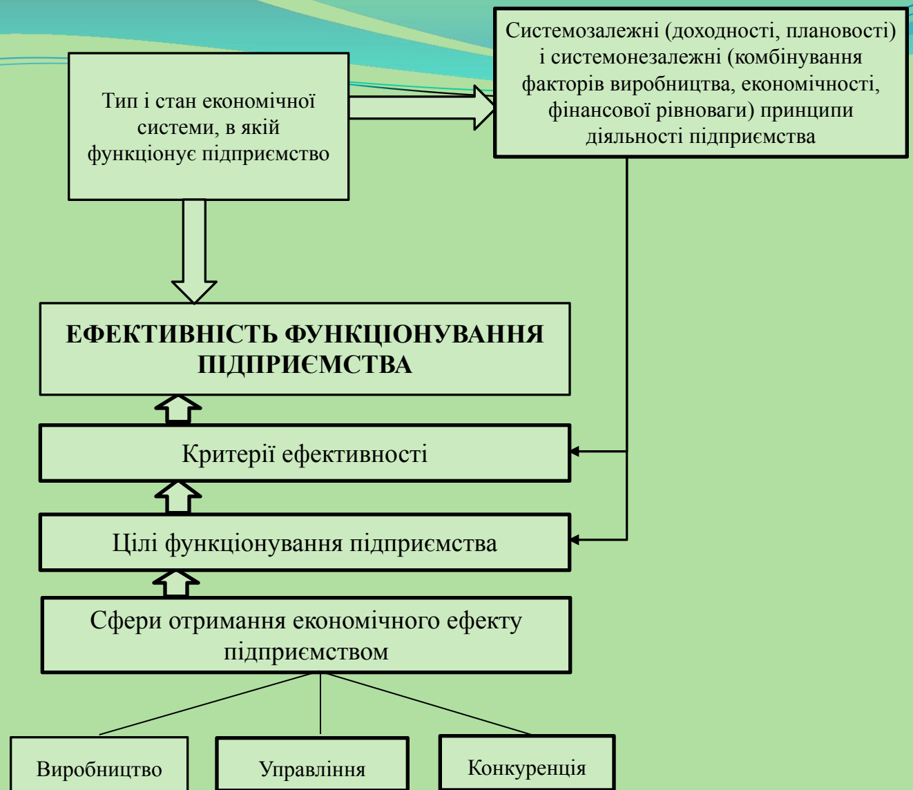
Рисунок 1 - Зміст категорії «ефективність функціонування підприємства» (авторське тлумачення)