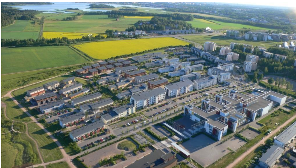
Рис. 3. – Житловий район Viikki, Хельсінкі, Фінляндія

Ще один житловий район схожого типу знаходиться в пригороді Хельсінкі, Фінляндія. Енергоефективний район Viikki (рис. 3) є експериментальним проектом програми Європейського товариства «Thermie». На території екологічного району розташовуються будівлі університету, научно-дослідницькі центри, житлові будинки, міська бібліотека, парк, зелені зони та споруди громадського призначення. Для кращого поглинання тепла всі будівлі орієнтовані на південь та південний захід. Завдяки врахуванню місцевих кліматичних умов з південної сторони передбачені галереї для проходу, які служать певним захисним екраном від вітру. Житлові будівлі обладнані системами механізованої та природної вентиляції, які забезпечують приміщення підігрітим зовнішнім повітрям і дають змогу контролювати температуру у кожному приміщенні. За обрахованими даними даний проект дозволяє знизити загальну кількість енергії, яка необхідна для тепло- та енергопостачання на 19% від існуючих нормованих значень [5]. На дахах і балконах деяких будинках установлені фотоелектричні панелі та сонячні колектори, які забезпечують централізоване теплопостачання.