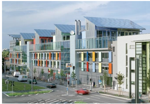
Рис. 2. – Комерційний центр «Сонячний корабель»

Ще один житловий район схожого типу знаходиться в пригороді Хельсінкі, Фінляндія. Енергоефективний район Viikki (рис. 3) є експериментальним проектом програми Європейського товариства «Thermie». На території екологічного району розташовуються будівлі університету, научно-дослідницькі центри, житлові будинки, міська бібліотека, парк, зелені зони та споруди громадського призначення. Для кращого поглинання тепла всі будівлі орієнтовані на південь та південний захід. Завдяки врахуванню місцевих кліматичних умов з південної сторони передбачені галереї для проходу, які служать певним захисним екраном від вітру. Житлові будівлі обладнані системами механізованої та природної вентиляції, які забезпечують приміщення підігрітим зовнішнім повітрям і дають змогу контролювати температуру у кожному приміщенні. За обрахованими даними даний проект дозволяє знизити загальну кількість енергії, яка необхідна для тепло- та енергопостачання на 19% від існуючих нормованих значень [5]. На дахах і балконах деяких будинках установлені фотоелектричні панелі та сонячні колектори, які забезпечують централізоване теплопостачання.