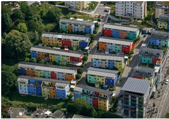
Рис. 1. – «Сонячне поселення», Фрайбург, Німеччина