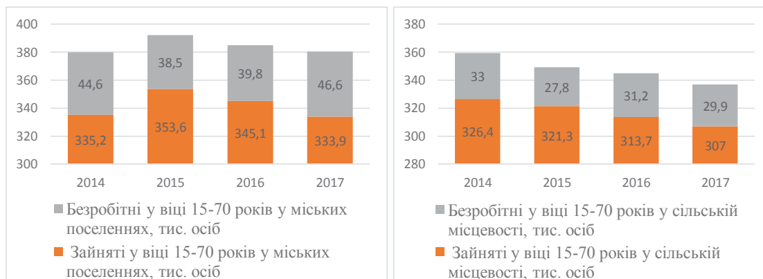
Рис. 1. Динаміка економічної активності сільського та міського населення у Вінницькій області у 2017 р. [11]