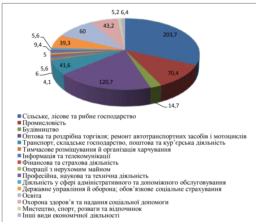
Рис. 2. Зайнятість населення за видами економічної діяльності у Вінницькій області у 2017 році (тис. осіб) [12]

збільшувався кількість безробітного населення у віці 15–70 років у міських поселеннях і у 2017 році становила 46,6 тис. осіб. Що стосується тенденцій розвитку регіонального ринку праці у сільській місцевості, тут також спостерігаються негативні тенденції, пов'язані з поступовим скороченням зайнятих у віці 15–70 років, а саме 307 тис. осіб у 2017 році, що на 6,7 тис. осіб (2,1%) менше, ніж в 2016 році, та на 14,3 тис. осіб (4,5%) та 19,4 тис. осіб (5,94%) порівняно з 2015 та 2014 рр. відповідно [11].