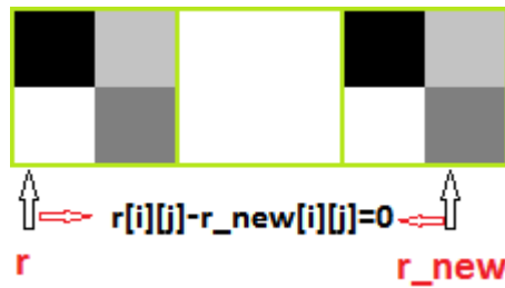
Рис.3. Класифікація рангових блоків

Під час розбиття на доменні блоки необхідно порівняти кожен новий усереднений доменний блок з усіма унікальними доменами, які було отримано раніше. Порівняння виконується наступним чином. Необхідно знайти різницю між кожним пікселем з унікальних та новим за формулою