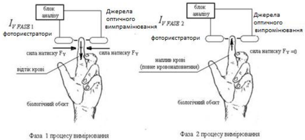
Рисунок 1 – Методика визначення концентрації глюкози у крові людини

Суть методу полягає у використанні двох фаз вимірювання на двох довжинах хвиль при ресстрації поглиненого оптичного випромінювання (дія на пропускання) та виконанні 3-х етапів: