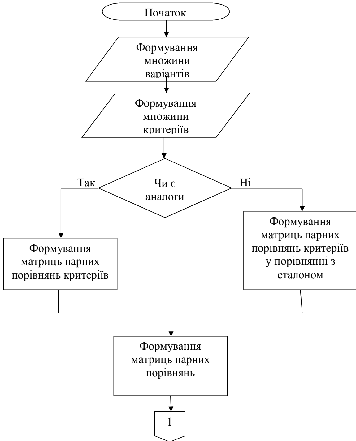
Рисунок 2 – Блок-схема узагальненого алгоритму реалізації комбінованого методу багатокритеріального аналізу варіантів у порівнянні з еталоном