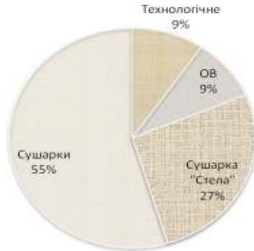
Риунок 3 – Структура теплого споживання підприємства для холодного періоду.

На підставі аналізу поточного стану теплоспоживання та теплогенерації були зроблено наступні висновки: