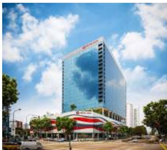
Рисунок 2 – Готель «Hotel Boss» у Сінгапурі

Для порівняння ціна на проживання в аналогічному 5-зірковому готелі в Сінгапурі «Hotel Boss» (рис. 2 ) у покращеному номері з двоспальним ліжком становить 2252 грн, де будівля готелю виконана в сучасній стилістиці з використанням суцільноскляного фасаду [4].