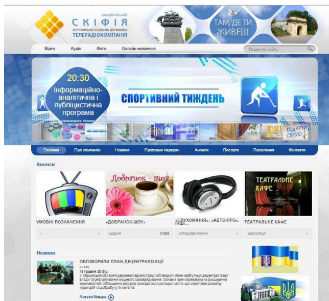
Рисунок 2 – Сайт «СКІФІЯ»

Сайт «СКІФІЯ» швидко та зручно завантажується. Цікавим також є інформаційний контент, орієнтований на відтворення новин компанії. Крім того,