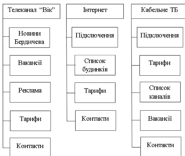
Рисунок 3 – Структура сайту «Телеканал Вік»

Висновок. Розроблена система керування контентом дозволяє динамічне оновлення інформаційного забезпечення сайту шляхом використання автоматизованої системи розміщення інформаційних новин в оперативному полі перегляду та в архіві бази даних. Розроблені сервіси системи дозволяють оцінку популярності інформаційних повідомлень та визначення рейтингу їх авторів, що, в свою чергу, робить можливим ведення статистичних досліджень популярності інформаційних повідомлень і впливає на тривалість транслювання новини в оперативному полі переглядів. Розроблена система керування контентом впроваджена на сайті «Телеканал ВІК – Новини міста Бердичева» та може бути використана для підтримки інших інформаційних сайтів.