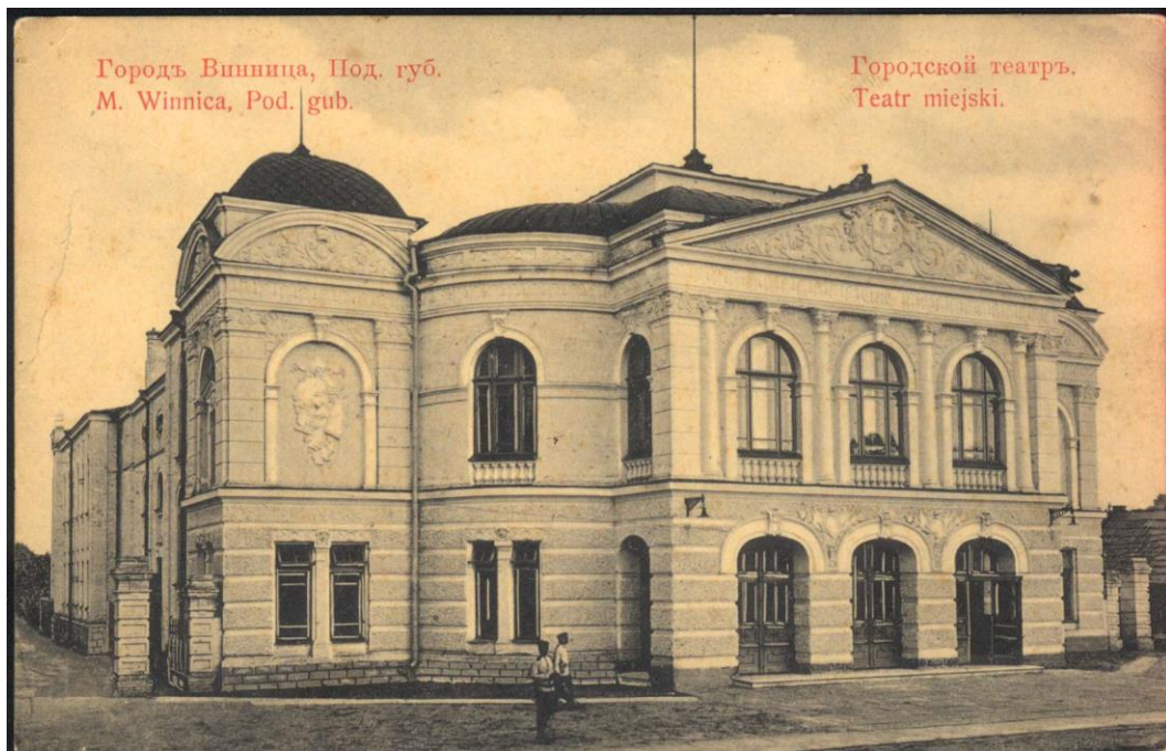
Рис. 3. Вінницький міський театр, 1910р.

Будівля театру виконана у неоренесансному стилі, якому притаманна симетрія та раціональне членування фасадів. Стіну головного фасаду двох поверхів оформлено рустами, вхідна група оформлена пласким портиком з чотирма напівколонами, що в цілому надає будинку монументальності. Центральну частину головного фасаду завершує стилізований фронтон-чоло з гербом міста в обрамленні ліпних гірлянд. Цікавим з архітектурної точки зору є симетричні бокові ризаліти, оздоблені рустами та увінчані аттиком з орнаментом та куполом зі шпилем (рис. 3).