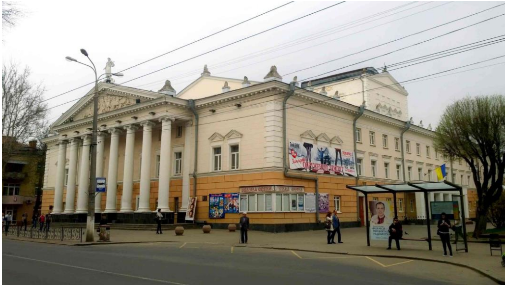
Рис. 4. ВОУАМД театр ім. М.К. Садовського, 2016р.

Приміщення будівлі значно розширені та мають функціональне зонування. Внутрішнє оздоблення театру представлене ліпними карнизами у залі глядачів. Стеля оздоблена ліпниною у вигляді колосся та квітів, що наближає театральне мистецтво до народної творчості. Загалом архітектура нової будівлі була покликана вселяти оптимізм та віру в майбутнє (рис. 4).