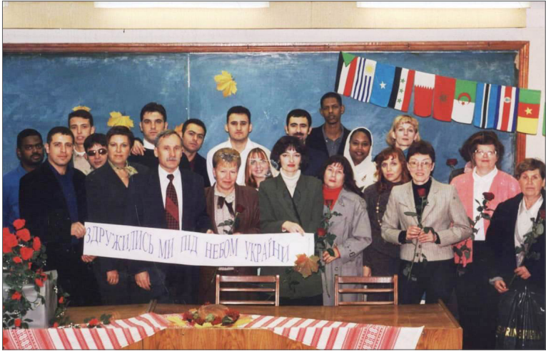
На святкуванні Міжнародного дня рідної мови. ВНТУ, 2005 р.