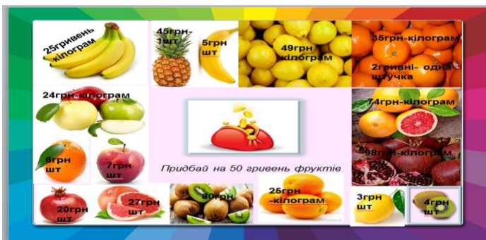
Рис. 2. Рисунок до гри-завдання «Придбай фруктів на 50 гривень»

Завдання мало на меті виявити розсудливість у придбанні товарів, розширити поняття «вигода», розвинути логічне мислення та практичну діяльність учнів. Кожне завдання оцінювалось певною кількістю балів. У разі успішного розв’язання всіх завдань дитина набирала 100 балів.